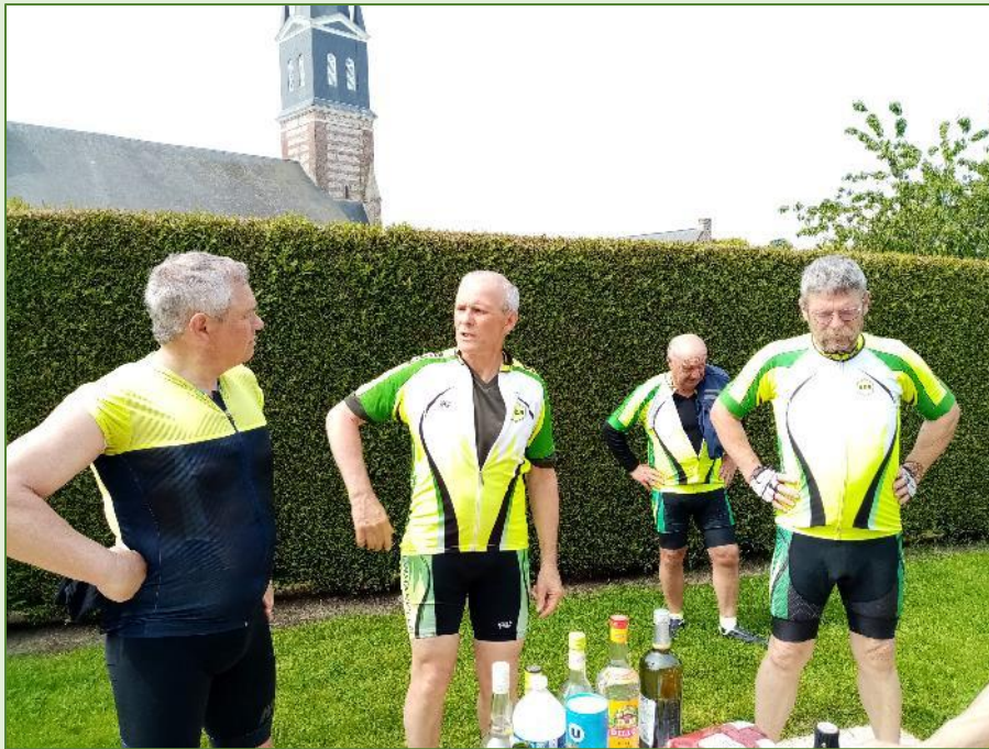
Un bel ensemble de « mains sur les hanches » ...

Visiblement, nos retraités sont bien fatigués !... Heureusement qu'il y a les filles !!!