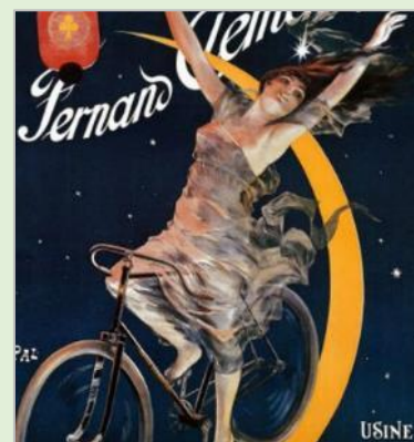
Affiche publicitaire pour les cycles Fernand Clément

Certains médecins vont même jusqu'à affirmer que la pratique du vélo est préjudiciable à leur santé et peut être responsable d'ulcérations, d'hémorragies, voire de stérilité et les détourner de leur devoir conjugal en éprouvant un plaisir sexuel, grisées par le grand air et la vitesse... ???