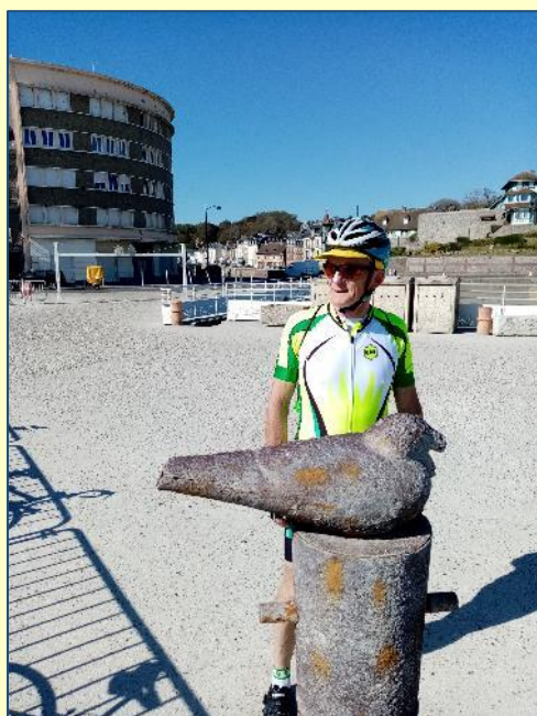
Le capitaine du navire