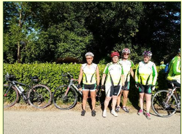
Les garçons s'octroient une pause...