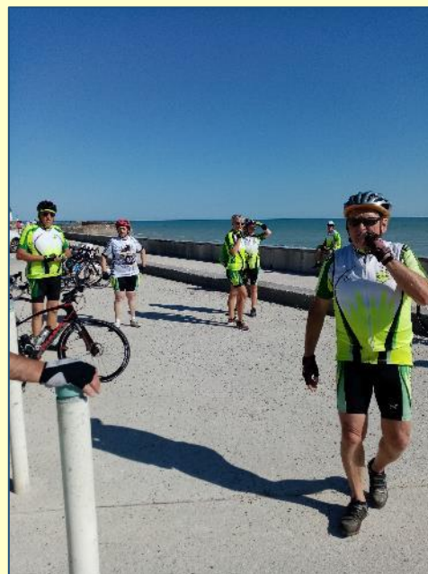
le chef mécanicien