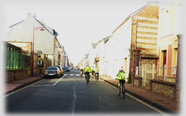
Traversée de Fauville-en-Caux