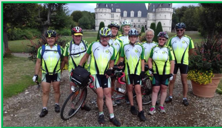
Pause photo devant le château de Mesnières en Bray.

Retour par la voie verte à belle allure ..... Il faut avouer que ça descend !