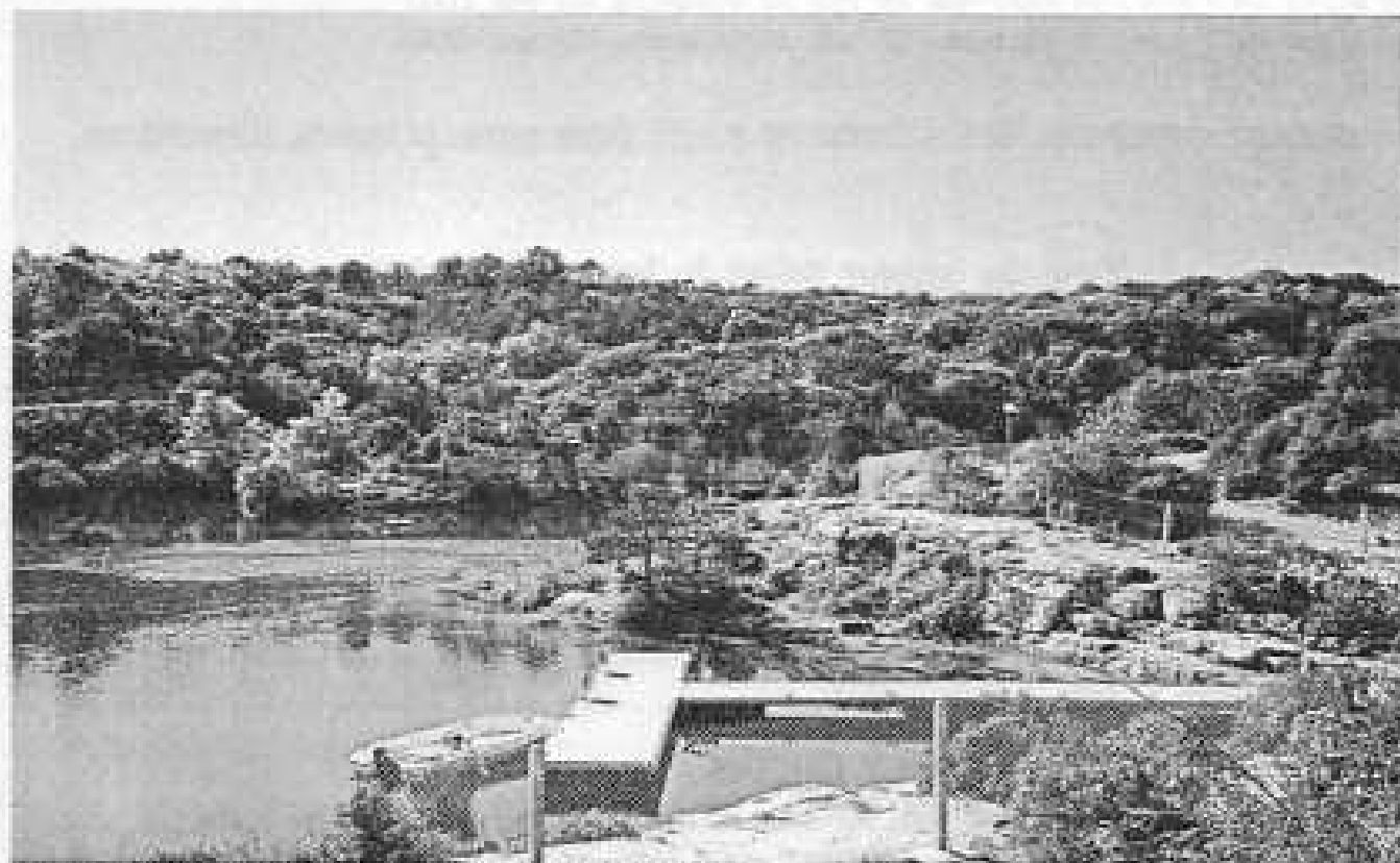
Photo : Port du coteau de la Marine en bordure du Verdon

Le Cat-cyclo vous attend pour un séjour au Bord du Verdon au Camping :