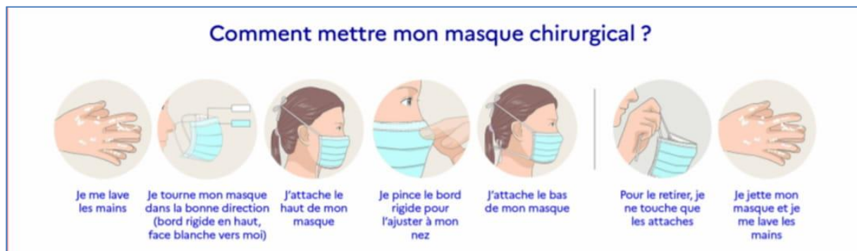
Figure 2: Mise en place du masque