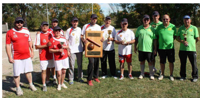
Le podium de l'édition 2015 : 1- S.Q. Senouillac / 2- S.Q. Bressols 3 / S.Q. Le Séquestre