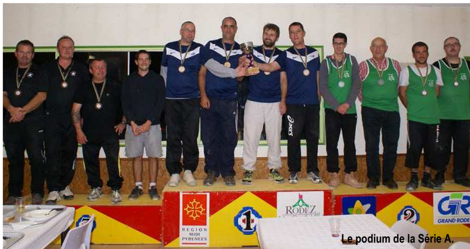
Le podium de la Série A.

Le rideau est tombé sur le championnat d'automne corporatif et les 60 équipes engagées avaient rendez-vous, le mardi 10 novembre, au quillodrome du Trauc, pour disputer la septième et ultime manche. Une organisation spéciale pour cette finale où le but est de faire évoluer toutes les quadrettes au cours d'une seule soirée mais aussi de se retrouver autour d'un bon repas, concocté et servi, comme il est désormais de coutume, par les vainqueurs du championnat d'automne de l'année précédente, en l'occurrence les Artisans et Commerçants de Flavin. Preuve d'une excellente convivialité, ce sont 235 repas qui ont été servis et des applaudissements nourris ont accompagné chaque équipe récompensée.