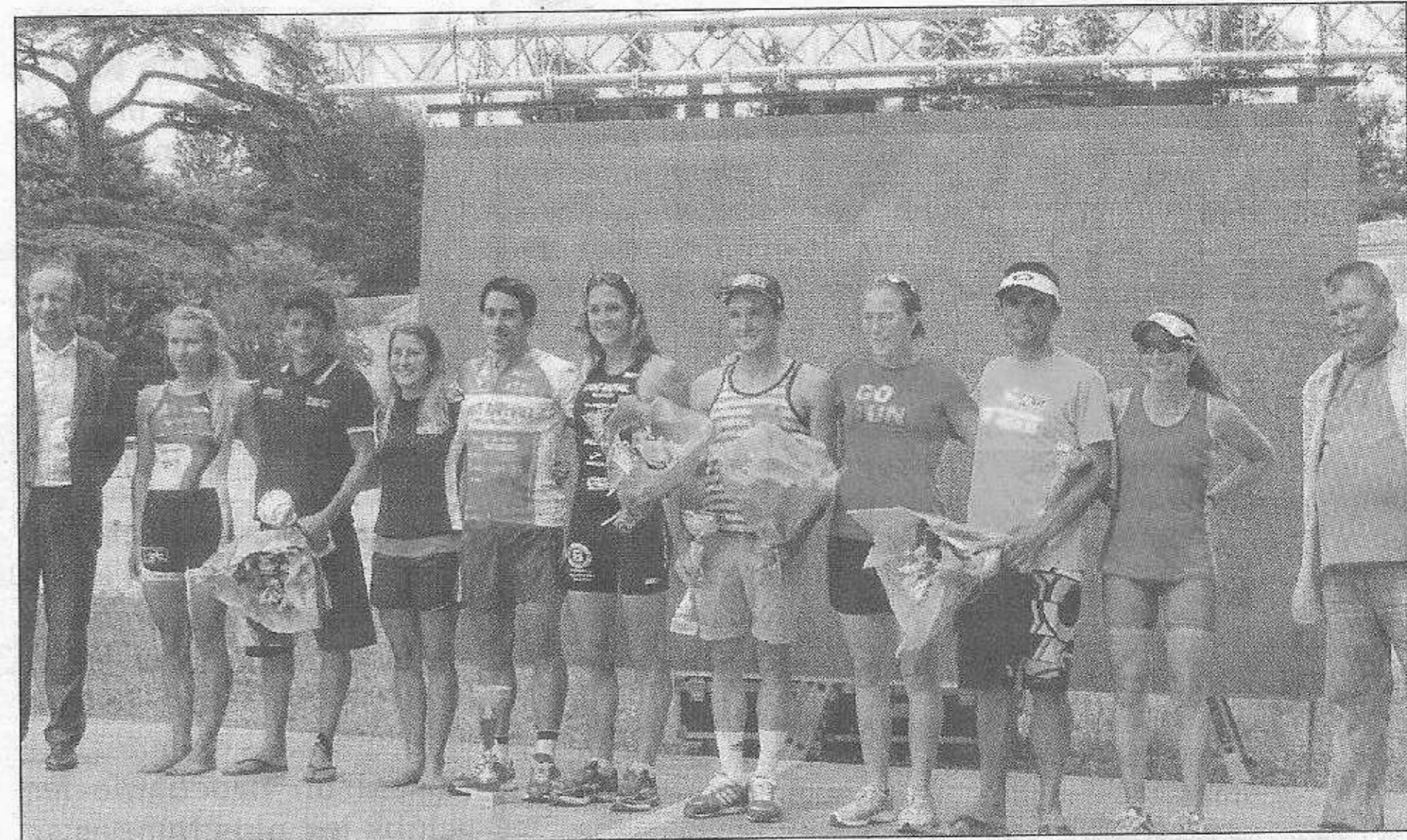
Les représentants du Draguignan Triathlon à l'heure des récompenses.