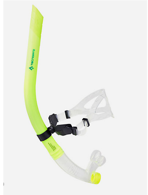
Tuba frontal :