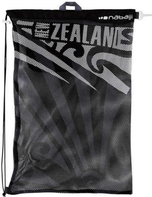
Filet de natation :