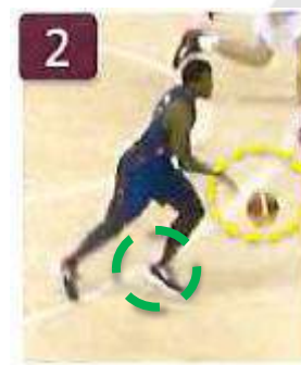
Dribble (ballon lâché) avant pose de l'appui n° 2