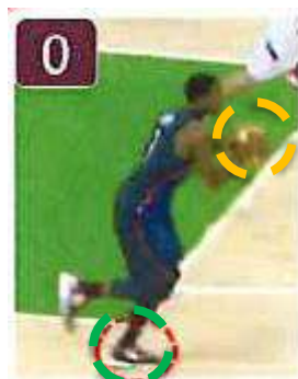
Appui n° 0