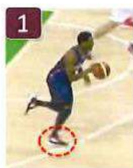
Appui n° 1