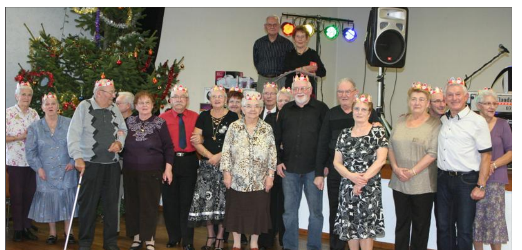
■ Les seniors ont bien débuté l'année.

Enfin, l'assemblée générale de l'association aura lieu le jeudi 14 février à 14 h à la salle des fêtes.