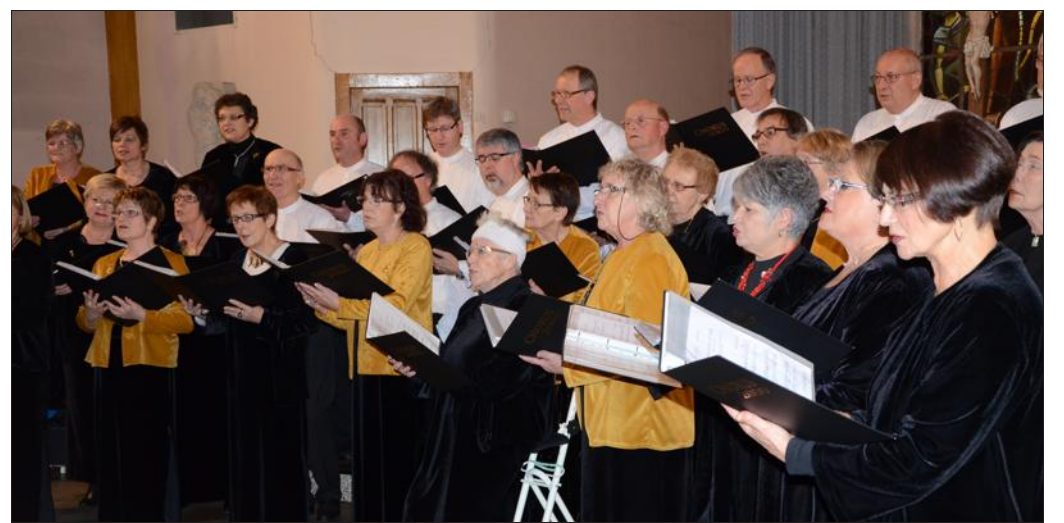
■ Les choristes dombaslois se sont forgé une solide réputation.