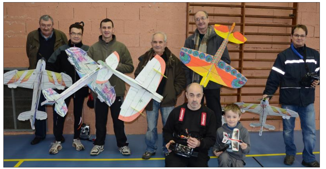
■ Les vols en salle ne durent que 3 à 4 minutes.

« C'est vrai que nos petits avions qui ont souvent des formes très surprenantes sont bourrés de technologie très performante permettant d'effectuer des figures impressionnantes », lance