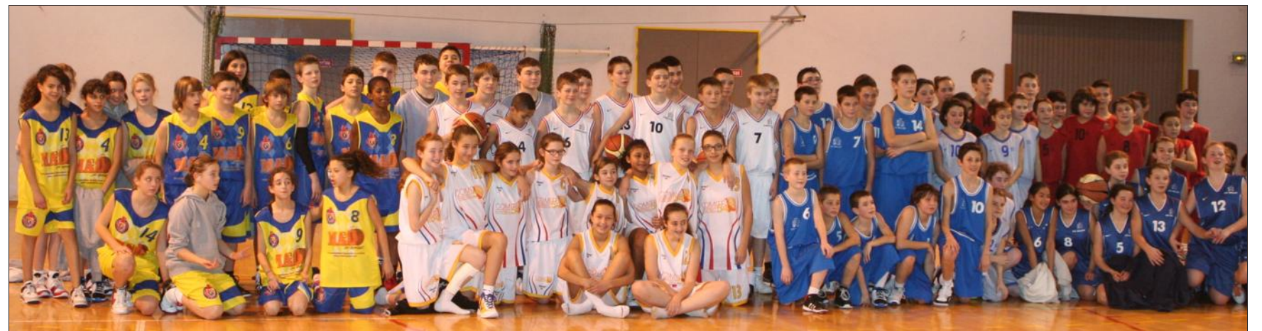
■ Les jeunes Lorrains se sont mesurés sur le parquet portois.

Organisé par l'AGP Basket et le Comité de Basket 54, sous l'égide de la Ligue Lorraine, le tournoi intercomité opposant les sélections garçons et filles de Meurthe-et-Moselle, de Moselle, des Vosges et de la Meuse s'est déroulé dimanche toute la journée au complexe Alexandre-Belleville de