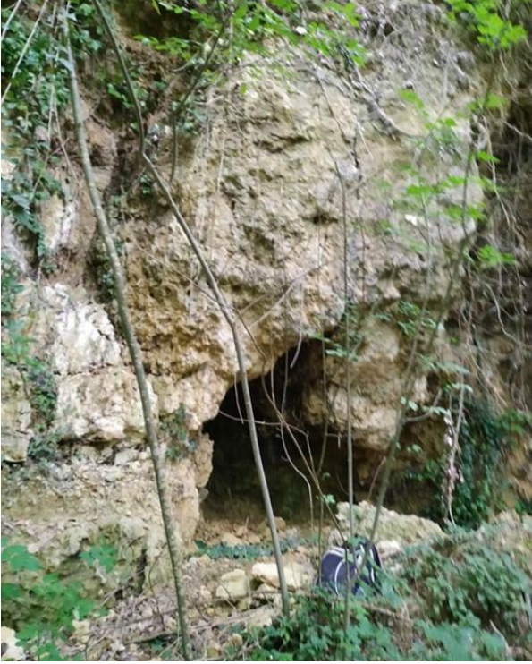
Fig. 3: L'entrée.