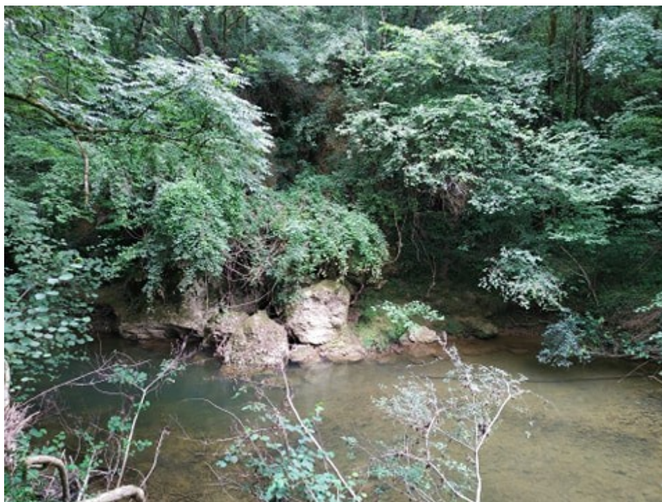
Fig. 1: Vue du site.