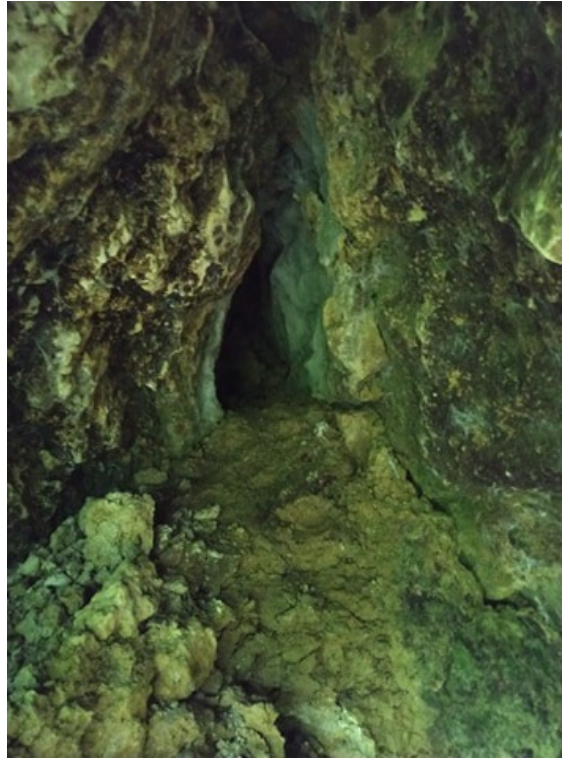
Fig. 2: L'intérieur.