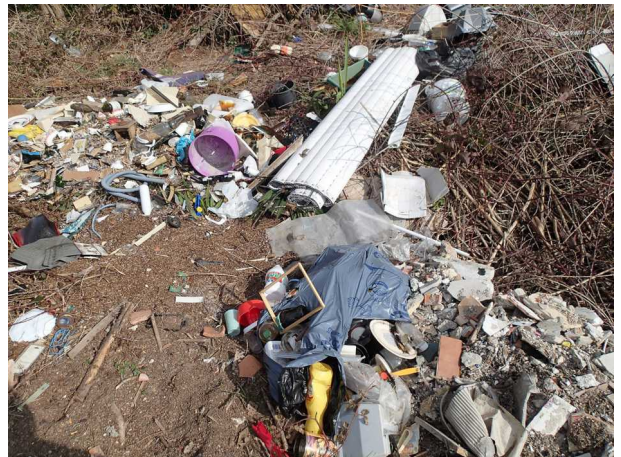
Illustration 2: Le dépôt sauvage