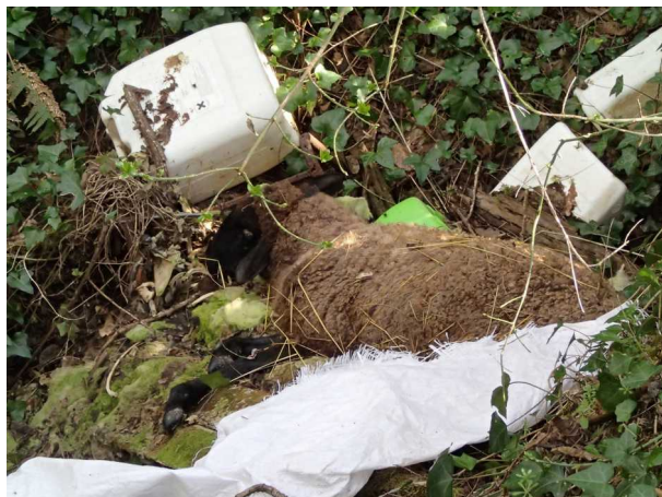
Illustration 4: Le mouton mort. La doline se trouve sous le bidon.