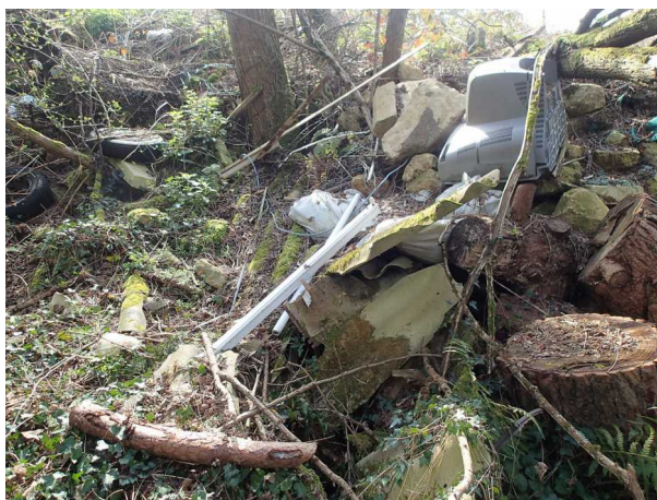
Illustration 5: Gravats et téléviseur proches du mouton mort.