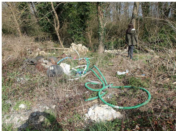
Illustration 3: Autre dépôt proche