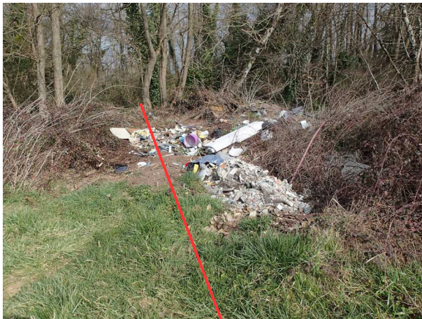
Illustration 1: Approche du site par le côté sud. La doline se trouve en arrière plan dans le bois, juste derrière le dépôt, le mouton mort se trouve derrière le dépôt.