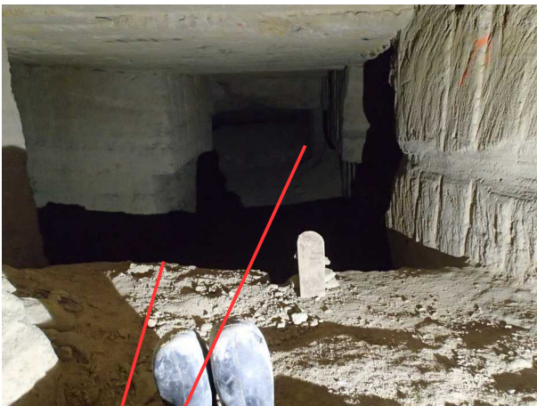
Illustration 8: Au premier plan le ressaut de 2,70m, au fond la carrière neuve