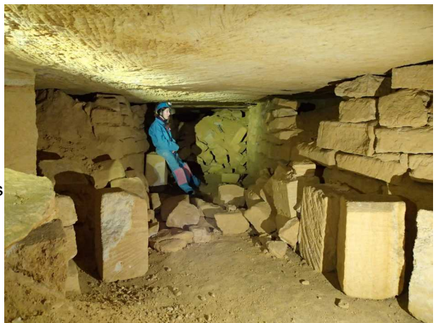
Illustration 4: La crypte des monolithes