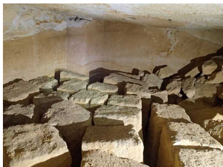
Illustration 12: Les monolithes