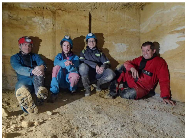
Illustration 5: Fin de la journée. Nous sommes bien sous terre avec les araignées, les chauves souris, les blaireaux, etc...