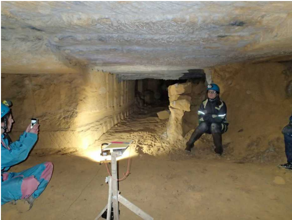
Illustration 6: Un carrefour, une galerie à droite, une galerie à gauche