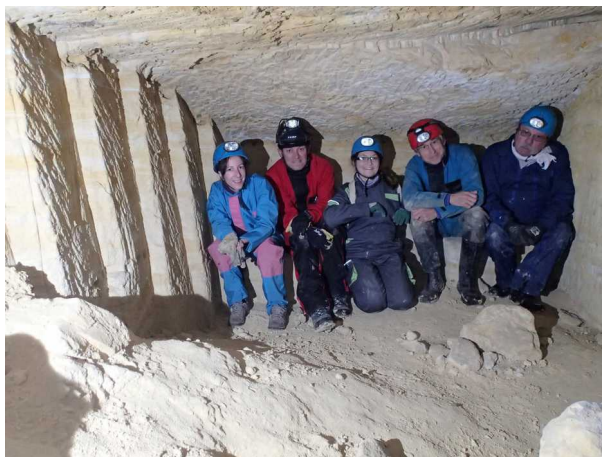
Illustration 1: L'équipe dans la crypte des dialogues ou des palabres

Nous arrêtons nos relevés pour le déjeuner, pris à l'entrée de la carrière.