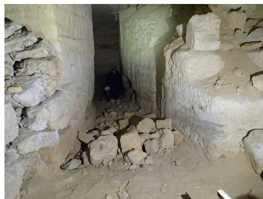
Illustration 2: L'entrée de la galerie des chauves souris, point de départ de la topographie