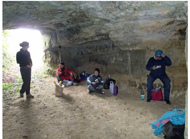
Illustration 7: Le pique nique à l'abri, et presque au chaud