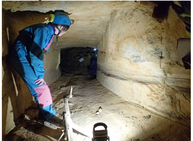
Illustration 3: Structure habituelle de la galerie des chauves souris

Nous exposons le résumé de notre sortie, et nous rejoignons la ville et ses particules fines.