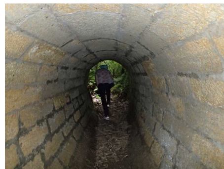
Illustration 2: Le tunnel - aqueduc qui passe sous la route. La progression s'y fait légèrement courbé pour les adultes.

La journée se termine, certains rentrent à Château Peneau en voiture, d'autres remontent par le circuit pédagogique.