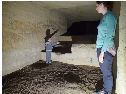
Illustration 5: Enfants et adultes explorent