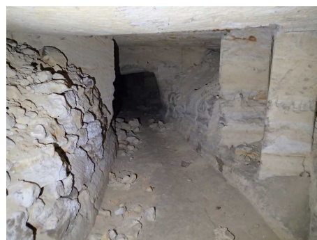
Illustration 3: La partie de la carrière non visitable par le public