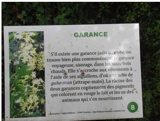
Illustration 4: Un panneau explicatif : La garance