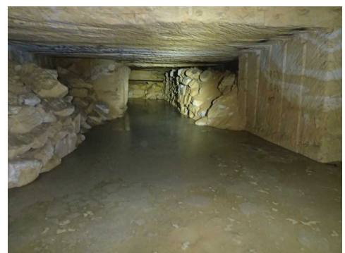
Illustration 9: Un lac. Sur la surface, la pellicule grise est de la "calcite flottante"