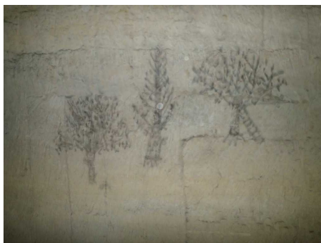
Illustration 5: Graffitis