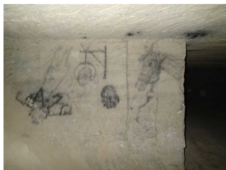
Illustration 6: Graffitis