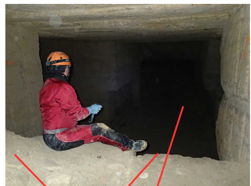
Illustration 10: Un des dangers du réseau : la galerie supérieure qui domine la carrière inférieure par un ressaut de 2m