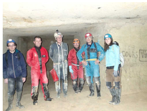
Illustration 1: L'équipe