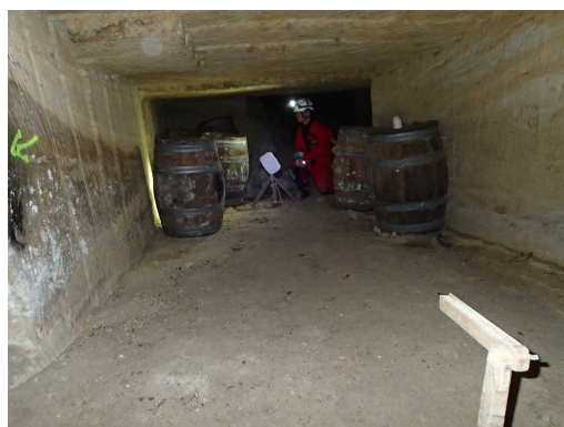
Illustration 2: Début de la topographie

Après ce moment tranquille, nous sommes pleins d'énergie pour explorer le maximum de galeries.