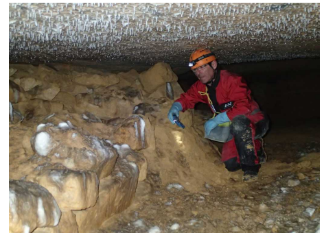
Illustration 4: Concrétions dans une galerie latérale sans issue