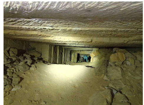
Illustration 8: Une galerie latérale bien marquée qui se termine sur un front de taille