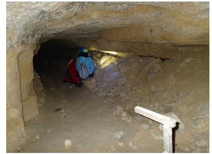
Illustration 3: La galerie des lacs et les parties latérales comblées

Vers 18h30 nous sortons dans un vallon lumineux par un petit porche qui semble naturel, peut être une ancienne grotte recréusée par les carriers. Nous sommes à 300m de l'entrée qui nous a accueillie à 14h30. Nous avons donc fait une boucle.