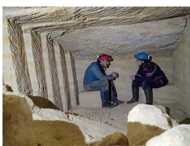
Illustration 5: Dialogue