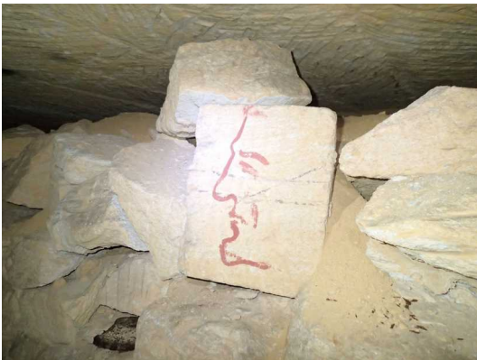
Illustration 9: L'inconnu de la carrière