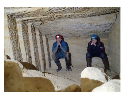
Illustration 6: Fâchés ?