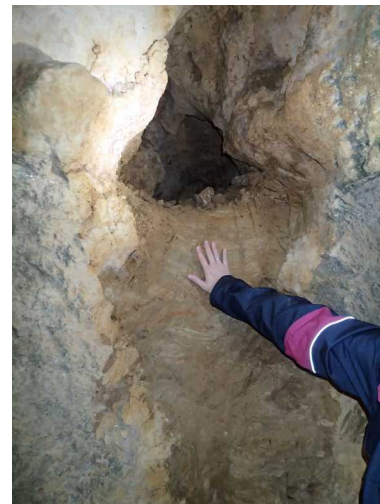
Illustration 1: Le boyau karstique et le remplissage d'argile

Le point 13 marqué le 29 mars 2018 se trouvait au bord du lac dont la surface de l'eau était couverte d'un beau voile de calcite flottante.