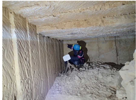
Illustration 10: Le dernier point topo de la galerie des lacs, c'est le terminus de cette partie. Remarquer la limite supérieure du niveau d'eau : la trace claire que montre Séverine