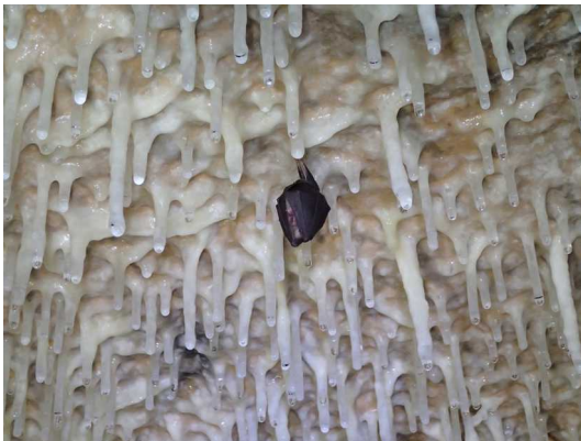
Illustration 11: Il n'y a pas que les humains qui apprécient les concrétions.