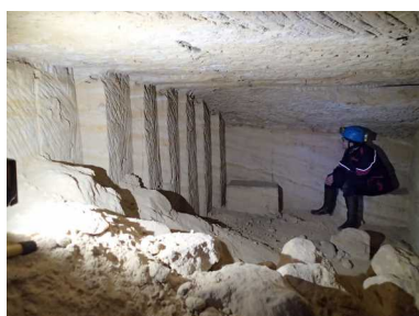
Illustration 4: Seule avec mes pensées