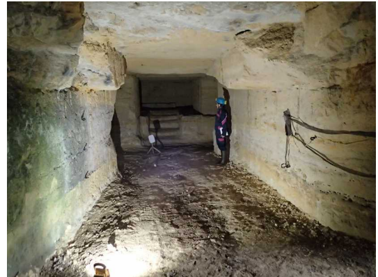
Illustration 3: Début des mesures à l'entrée (Stations E1 → E2). Remarquer l'éclairage d'appoint avec le projecteur LED

Devant la cheminée en pleine action, 2 grands bols nous attendent ; quelques minutes plus tard, les arômes de chocolat nous redonnent toute l'énergie nécessaire pour rentrer en ville sous la pluie et le vent, après quelques discussions avec notre hôte.