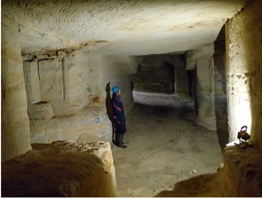
Illustration 8: La partie proche de l'entrée