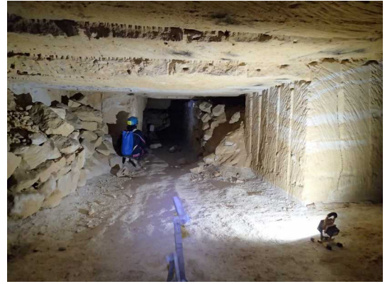
Illustration 7: Exemple de station de topographie. Cette structure de galerie se rencontre en général dans cette carrière. Derrière chaque mur de moellons se trouve souvent une galerie d'extraction comblée qui se termine souvent par un front de taille sans suite.