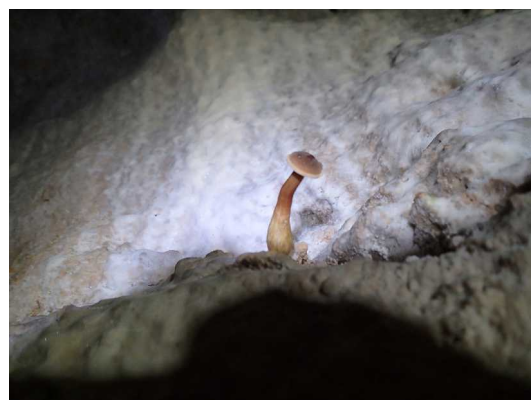
Illustration 2: Le champignon spéléologue