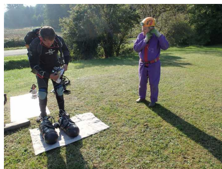
Illustration 1: Équipement

12h30 : déséquipement complet, fin de la sortie.