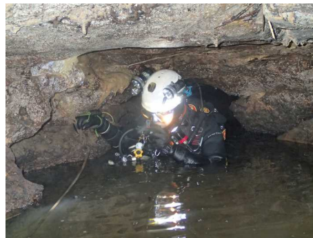
Illustration 3: Apparition au siphon de la perte après 55m de plongée