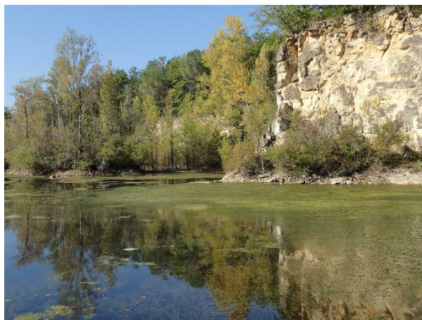
Illustration 8: Le lac de la carrière de Jeandillon