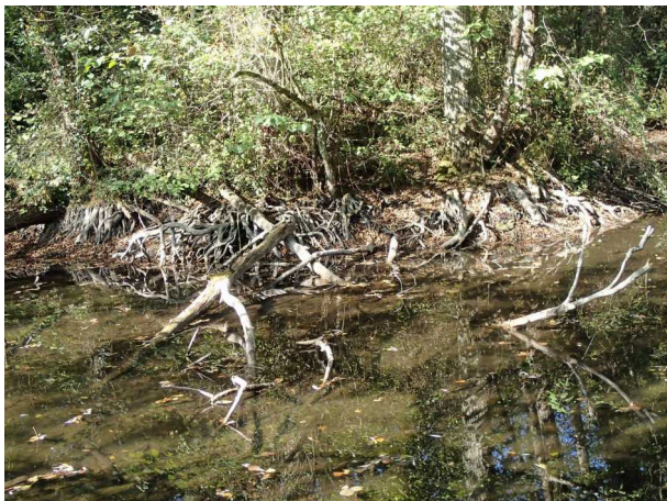
Illustration 7: Mangrove girondine