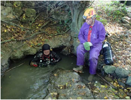
Illustration 4: Au retour, émergence du siphon de la résurgence