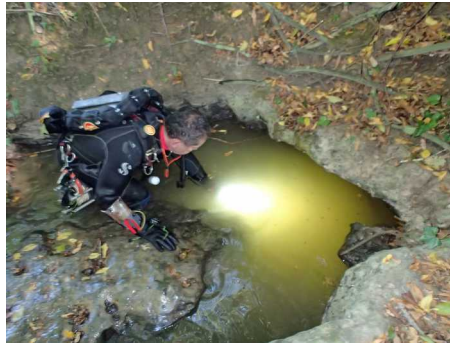
Illustration 5: La couleur de l'eau tout au long du trajet, couleur qui s'est imposée 2m après l'entrée