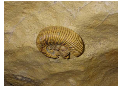
Illustration 4: Grotte de la Fuie : le fossile