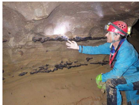
Illustration 1: Grotte de la Fuie : les silex