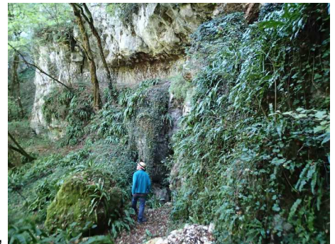
Illustration 5: Gouffre de l'Ermitage : au fond, les falaises à étudier