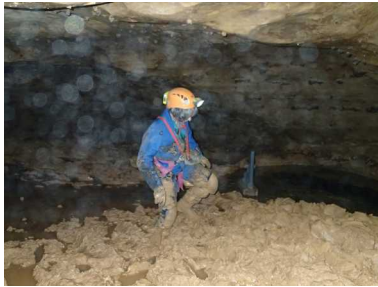
Illustration 2: Grotte de la Fuie : l'argile

Le samedi soir, nous nous retrouvons pour une soirée repas en commun réussie.