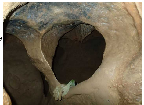
Illustration 6: Grotte de Gratte-Chèvre : effet de roche, le soupirail

Comme les difficultés s'amoncellent et que je commence à être loin de l'entrée, je décide de terminer ici ma visite.