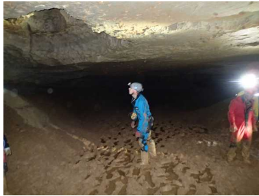
Illustration 3: Grotte de la Fuie : les volumes