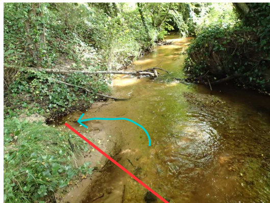
Illustration 3: La perte secondaire du Goua-Sec

Repérée il y a déjà quelques années, une petite partie du Goua-Sec se perd latéralement rive gauche 200m en amont de la perte principale. Je vais vérifier si elle n'a pas été modifiée, obstruée par la crue. La perte est toujours active et visible. Quelques litres par seconde sont absorbés dans les végétaux. Nous ne savons pas où ressort cette eau.