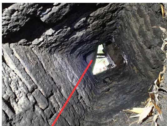
Illustration 5: Le puits à la pierre ronde, vu à partir du bas

Nous en profitons pour faire quelques observations sur les puits ouest de la pierre ronde. Je positionne en topographie les puits par rapport à la borne ZERO posée par Michel.