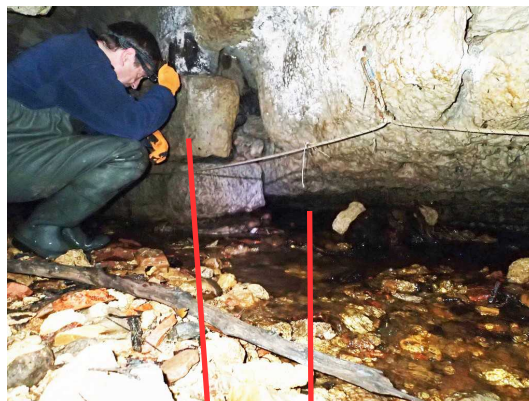
Illustration 2: L'arrivée de l'actif de la perte dans la galerie principale à la fin de la partie bâtie