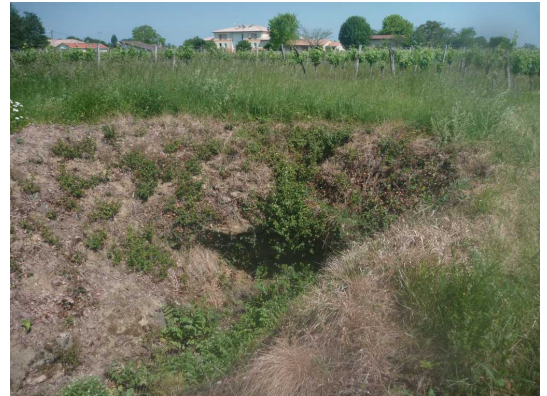
Illustration 1: La perte vue de la surface

On rampe à plat ventre et on se trouve au-dessus du plafond de jadis devenu plancher...on voit le ruisseau tout en bas .... »