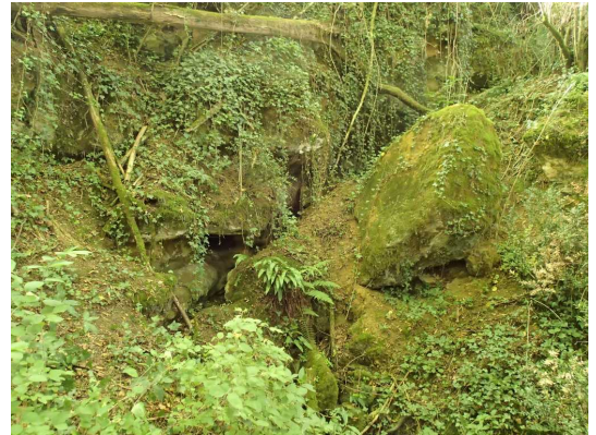
Illustration 2: La grotte des Guyonnets, les éboulis

Le site est situé à 1km au sud-ouest de Le Galouchey. Nous garons les voitures en bord de route. Nous descendons vers le ruisseau de Le Galouchey en passant dans une friche envahie d'herbes sèches. Un sentier est marqué entre les herbes. Arrivés au niveau du ruisseau Le Galouchey, nous pénétrons dans la forêt en remontant le ruisseau par sa rive droite. Bientôt nous arrivons devant un tombant de 10 m de haut encombré de gros éboulis, sous lesquels sort un petit écoulement. Nous remarquons après avoir écarté le lierre quelques départs de boyaux et une arrivée d'eau. Un peu plus haut entre les blocs, il est possible de passer. Après quelques photos, nous décidons de jeter un coup d'oeil plus précis.