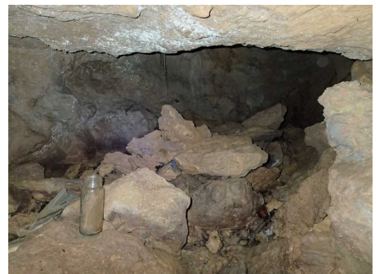
Illustration 4: La galerie et la salle au fond

Il semble que cette cavité ne soit pas connue dans nos archives et notre base de données Karsteau. Il semble que nous avons découvert une nouvelle grotte qui vient enrichir le patrimoine girondin.