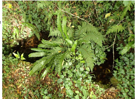
Illustration 5: La source aménagée du Bourillon