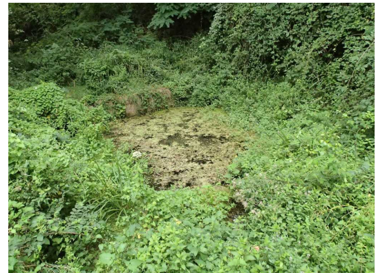
Illustration 6: Le lavoir de la source de Mouchac

Nous terminons la journée en reprenant quelques forces chez Le Pèlerin.