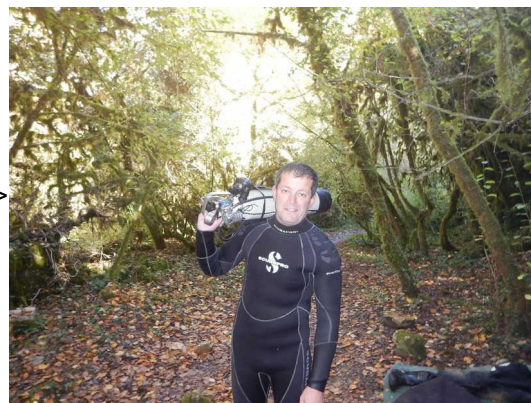
Illustration 1: Trou Madame préparatifs