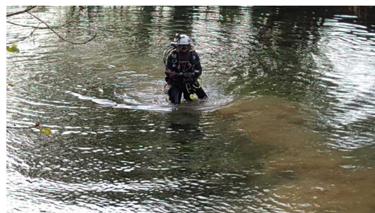
Illustration 2: Départ