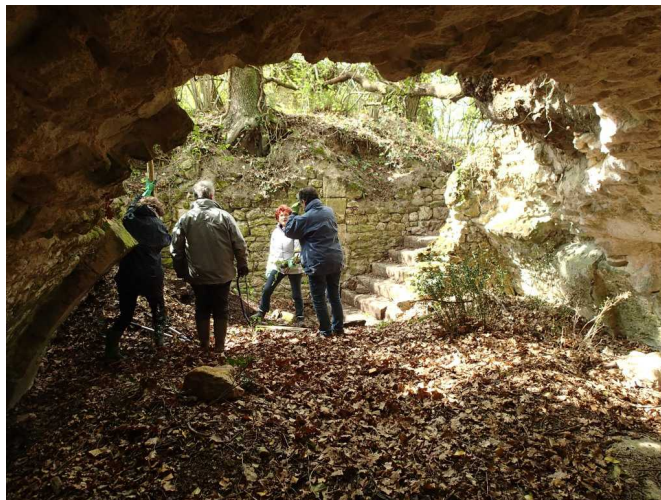
Illustration 2: La salle souterraine et l'escalier

Pour tout autre usage, nous contacter : www.cres-merignac.fr