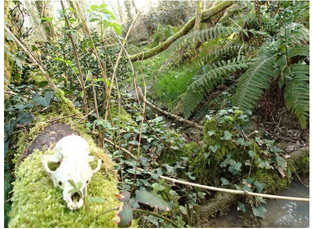
Illustration 4: L'enfer vert de l'Entre-Deux-Mers