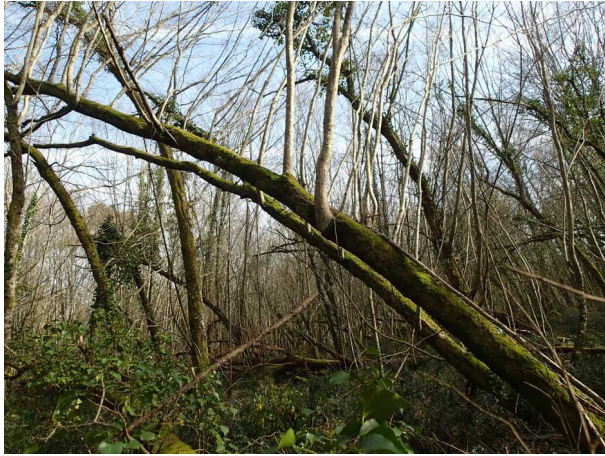
Illustration 3: La forêt malmenée, même couchés, les arbres survivent