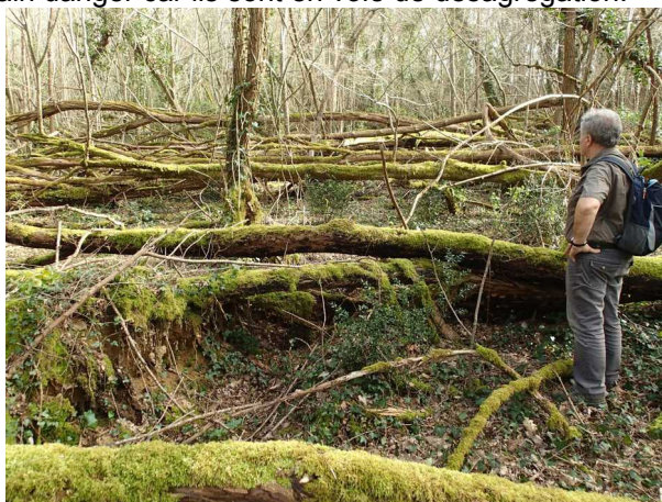
Illustration 2: Les arbres couchés par les anciennes tempêtes (1999, 2004?...)