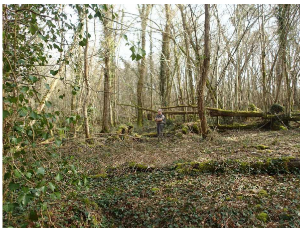
Illustration 1: Le bois de Mahourat sud

Quelques photographies témoignent du site. Je reviens vers mon point de départ via le chemin qui rejoint le lieu dit Bibard.