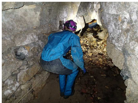
Illustration 1: L'entrée artificielle de la grotte. La cavité naturelle est au fond.