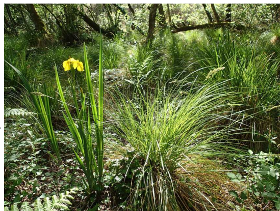
Illustration 3: La zone humide et les iris