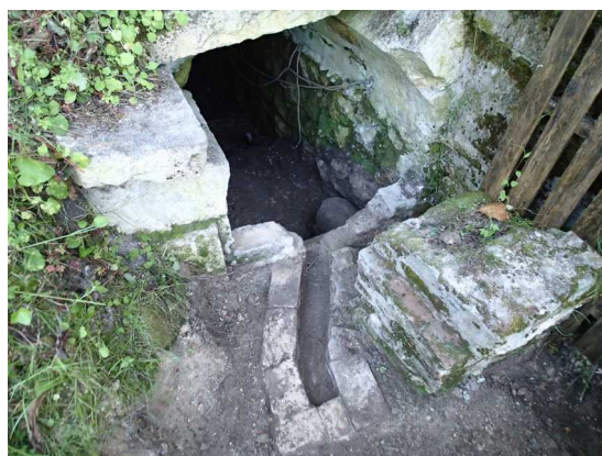
Illustration 2: L'entrée du souterrain nettoyé. Les chenaux mis à jour