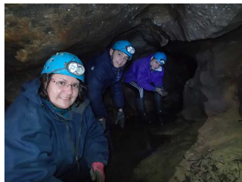
Illustration 3: Les explorateurs

Il nous reste du temps, aussi, nous en profiterons pour voir les entrées de la grotte Noire de Mauriac et de la grotte de Pellegries, de manière à avoir une idée sur les premiers mètres de ces grottes.