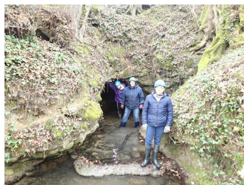
Illustration 2: L'entrée de la grotte du Grand Pont

Les bottes sont vite remplies dès les premières vasques. La progression ne pose pas de difficultés. La galerie est grande au départ, elle se rétrécit de temps en temps, les formes de galerie sont variées, « Trou de serrure ; méandre ; canyon ».