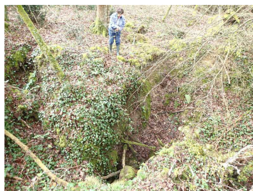
Illustration 1: La doline d'entrée de la grotte du Bois de la Colonne qui donne accès au réseau de Villepreux

Avant la visite, le pique-nique s'impose sous un ciel assez bas, mais avec quelques rayons de soleil.