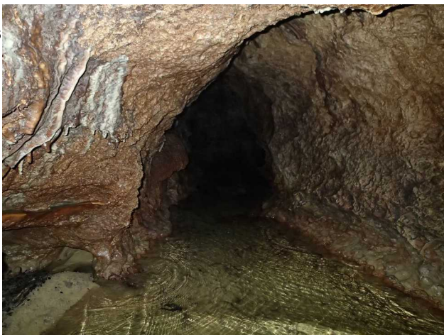
Illustration 4: Vue vers la suite de la galerie, l'eau est limpide, elle n'attend plus que les explorateurs. A suivre.