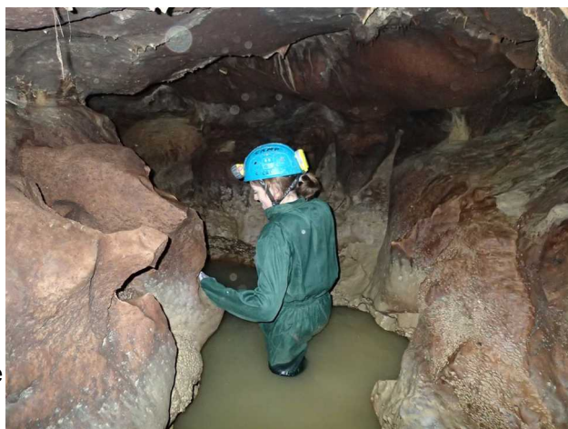
Illustration 3: Les premières vasques, impossible de rester les pieds au sec.