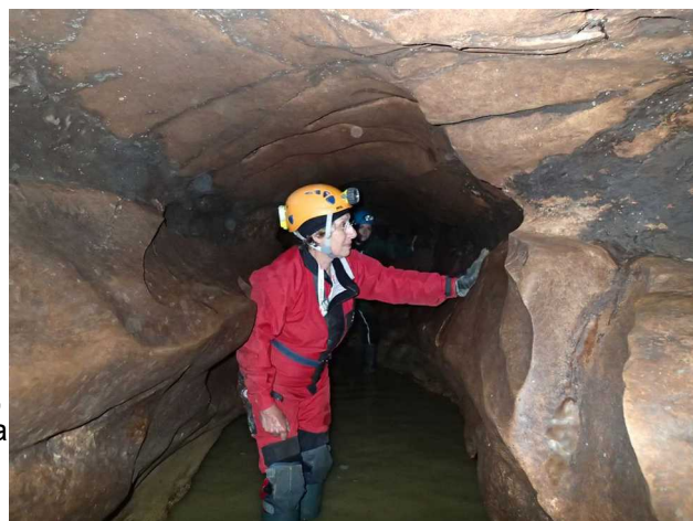
Illustration 2: Un aspect de l'esthétique de la galerie, minérale, peu de concrétions

Au début le ruisseau au faible débit coule librement sur la roche et les graves. La galerie se présente sous des formes variées, esthétiques, avec peu de concrétions.