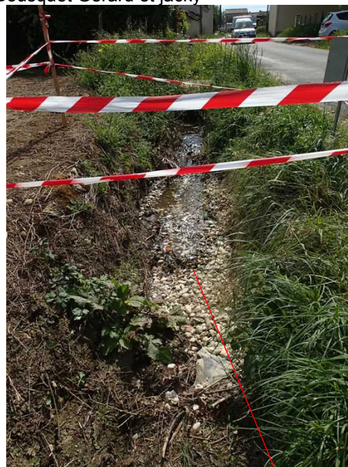
Illustration 3: Le fontis, la perte dans les graviers

Au moulin de Lamothe, nous rencontrons l'habitant du lieu qui nous indique une résurgence au pied de son moulin, rive droite. En effet, sous un porche surbaissé et bien formé, une résurgence active aux eaux claires se mélange aux eaux troubles du Ciron. Un peu en amont, un lavoir est inondé et se dégrade. Les repérages étant faits, nous retournons vers le fontis de La Carotte. Le fontis de La Carotte capture entièrement les eaux du fossé qui devraient aller dans le vallon qui fait suite et qui alimente les ruines du bord du Ciron au lieu dit Bataney, vues précédemment.