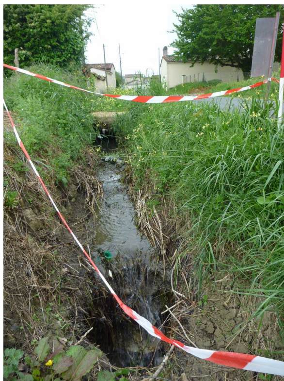
Illustration 1: Vues vers le Sud-ouest, vers l'amont