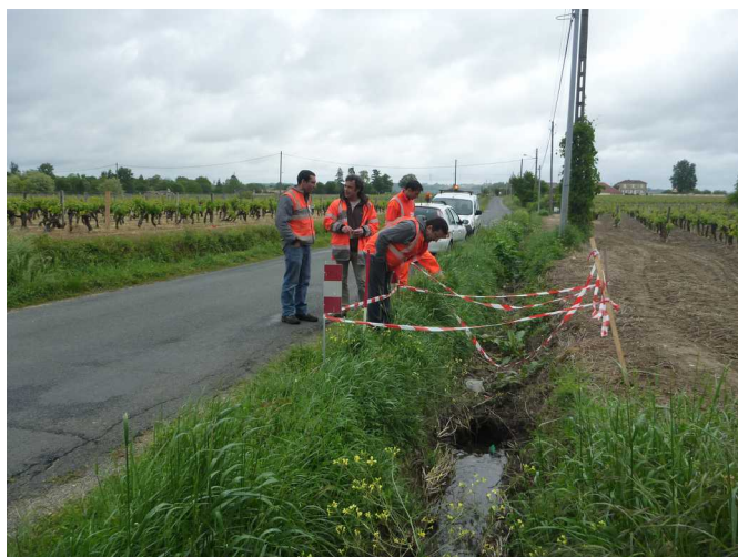
Illustration 2: Vue vers le nord-est, vers l'aval