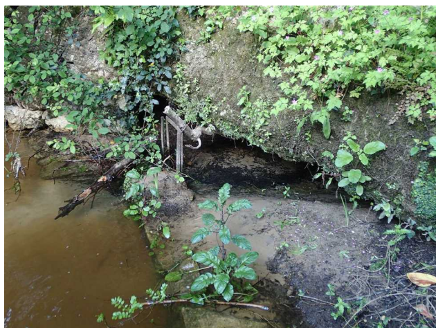
Illustration 4: La résurgence du Moulin de Lamothe