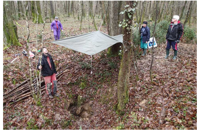
Illustration 2: Nos aménagements

L'accès à ce document n'entraîne aucun transfert total ou partiel de propriété sur ces données et images dont l'utilisation est strictement limitée à un usage privé et à des besoins internes