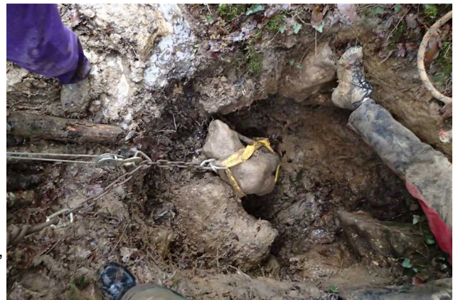
Illustration 5: L'extraction