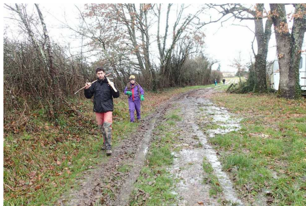
Illustration 1: La descente vers le puits de la Bergère des Roudiers

Nous prendrons le repas de midi à l'abri du hangar des Roudiers pendant qu'un énorme grain avec bourrasque secoue le pays