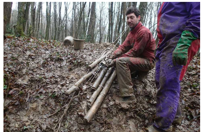
Illustration 4: L'installation