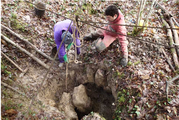
Illustration 3: Les blocs prêts à sortir

L'après midi un léger rayon de soleil nous encourage. Et c'est reparti avec la même vigueur. L'argile très collante est dégagée, et il ne reste que les blocs de calcaire à sortir. Nous installons le tire-fort, corde, câble, chaînes, chacun s'active.