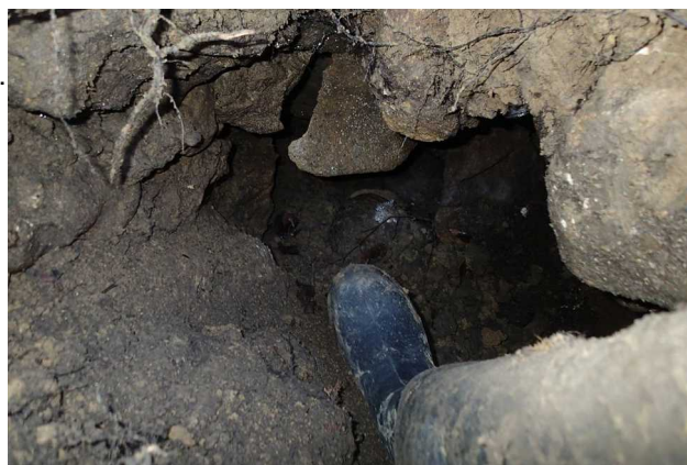
Illustration 3: Une vue de la suite. Nos travaux ont fait tomber un peu de terre au dessous.

Un dernier coup d'oeil, quelques photos, et nous sécurisons le site.