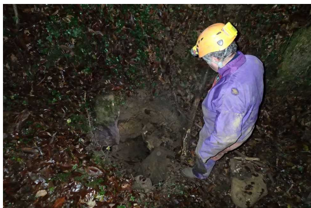
Illustration 5: Le site à la fin du sondage