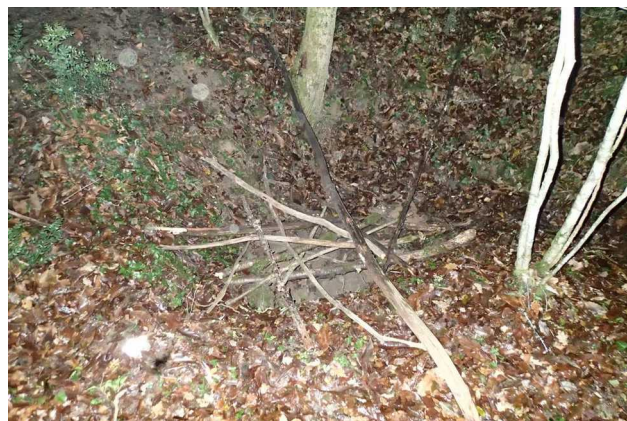
Illustration 4: Le site sécurisé

Le retour se fait dans la nuit, nous n'avons pas peur des elfes et autres esprits errants, je sais qu'il nous aiment bien en fait.