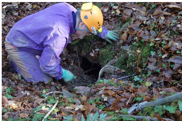
Illustration 2: L'entrée telle qu'elle se présentait le 18 décembre 2013

Michel piaffe, dès le signal du départ donné, il se jette sur la petite entrée et gratte immédiatement.