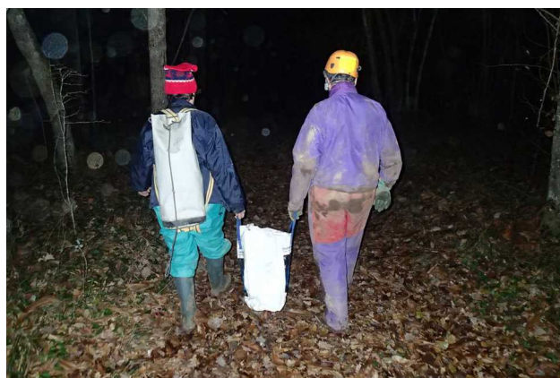
Illustration 6: Le retour des spéléos.