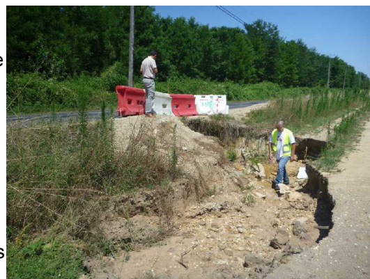
Illustration 2: Le fontis; vue vers le nord

Nous avons bien repéré la zone marécageuse. Nous n'avons pas trouvé de résurgence.