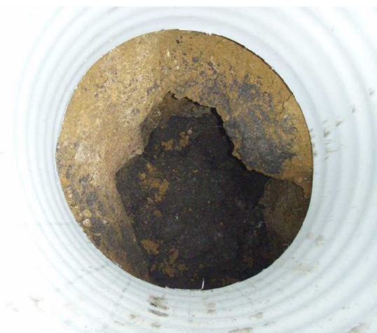
Illustration 3: L'orifice de la perte au fond de la buse verticale