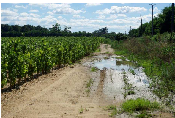
Illustration 8: Une laisse d'eau en amont de la perte