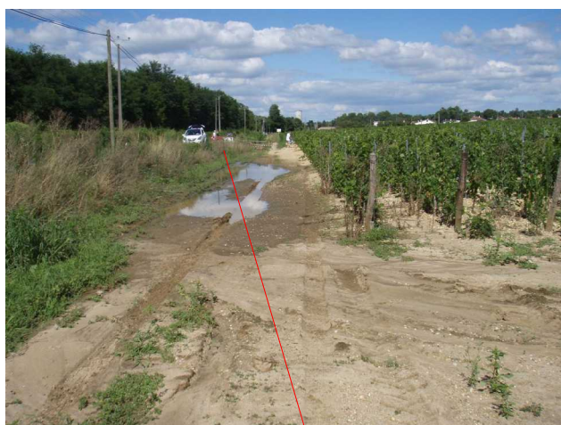
Illustration 5: La perte est située au niveau du véhicule ; vue vers le nord