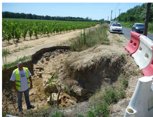
Illustration 1: Le fontis à la date du 1er août 2013 ; vue vers le sud.

La secrétaire nous indique que la vigne du site de la perte a été créée il y a 2 ou 3 ans seulement. Auparavant, il y avait une friche. D'ailleurs les photos aériennes le montrent bien. Voir le site de l'IGN.