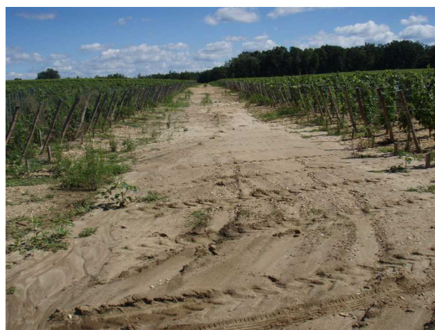
Illustration 6: Le bassin d'alimentation de la perte ; vue partielle vers l'est