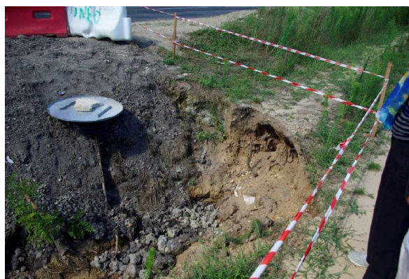
Illustration 4: Le site aménagé avec la buse verticale, sous le panneau