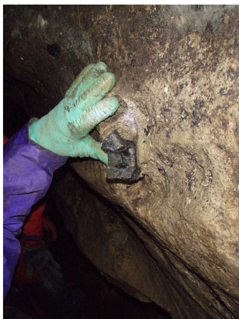
Illustration 6: La vertèbre fossile

Nous remarquons une magnifique vertèbre fossile qui dépasse de la paroi.