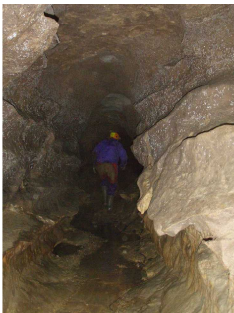
Illustration 3: Départ dans l'affluent rive droite

Au fur et à mesure de notre progression, nous rencontrons les premières difficultés sous la forme de ponts rocheux à enjamber ; il faut s'allonger et frotter la voûte, cela nous change.