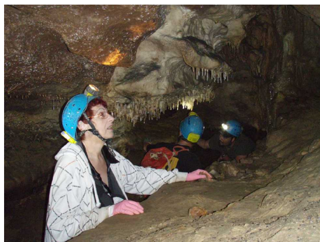
Illustration 5: Quelques concrétions à admirer

Cela fait maintenant pas mal de temps que nous sommes sous terre.