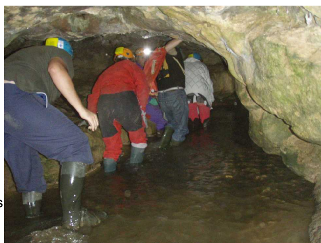
Illustration 2: Les premiers mètres souterrains.