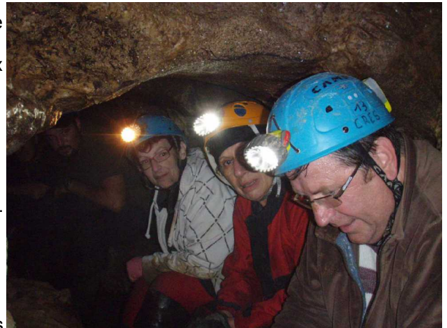
Illustration 7: Récupération.

La dernière épreuve est de repérer la direction des véhicules, ce qui n'est pas évident. 90% des spéléos se sont trompés, je ne dirai pas les noms ici.