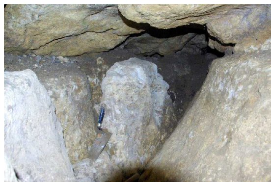
Illustration 2: La dent de sagesse

A 13 h30 reprise des actions jusqu'à l'arrivée de Gérard vers 15 h qui va poursuivre les grattages et mouvements entrepris jusqu'à obtenir un dégagement de la plus grosse pierre nommée « la dent de sagesse » la précédente avait été nommée « la molaire ».