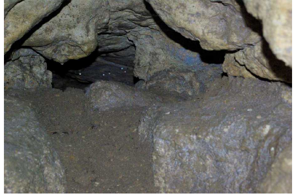
Illustration 5: La suite photographiée par Michel