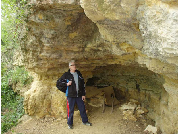
Illustration 4: Guy de retour