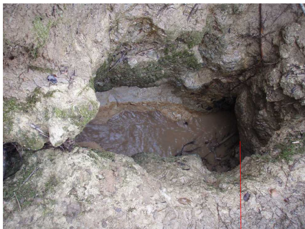
Illustration 2: La baignoire. Vers l'aval

La totalité du débit se perd dans la baignoire rive gauche. L'eau ne revient pas sous la doline aval. Elle semble aller directement vers le réseau.