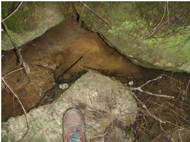
Illustration 5: L'entrée, basse et impénétrable