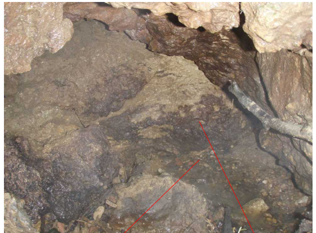
Illustration 4: Détail de la perte rive gauche. L'eau s'infiltré entre roche et éboulis

Je fais quelques photos et un repérage GPS.