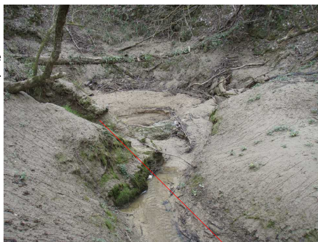
Illustration 1: Le Grand Gouffre-perte de la Mouleyre. La baignoire

Pour l'instant, le boyau aval est impénétrable.