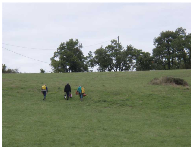
Illustration 11: Retour vers la civilisation

Acteurs : ASCA (Patrick, Roger, Thibaud)