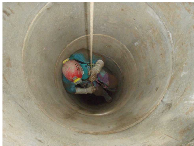
Illustration 1: Patrick monte le puits artificiel

L'objectif est ts sortir tous les gravats créés par la dernière désobstruction. Cela nous prendra les 2 séances de la journée.