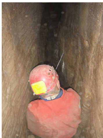
Illustration 3: Patrick agrandit le méandre

Une fois l'ensemble de l'équipe bien placé, les extractions de gravats se déroulent sans incident.