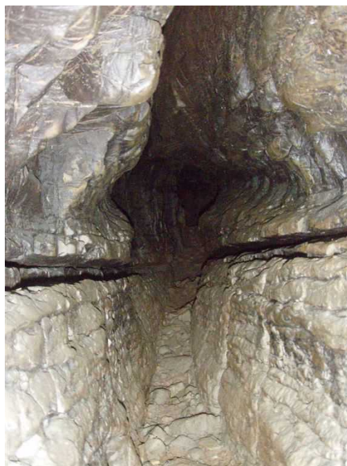
Illustration 10: La suite