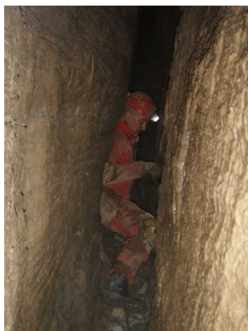
Illustration 7: Roger en action dans le méandre