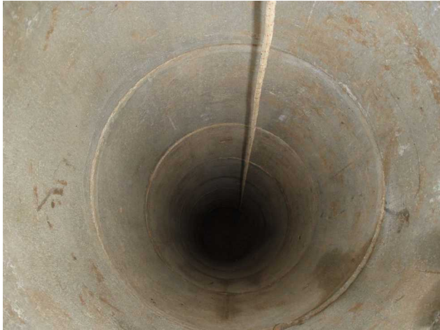
Illustration 4: Descente en terre inconnue