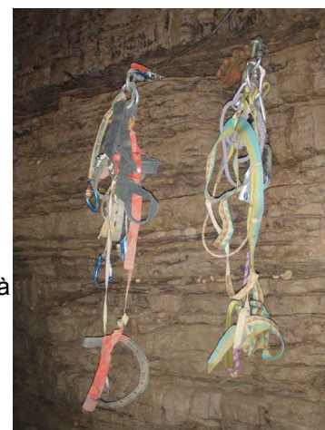
Illustration 2: Les pendus

Nous terminons la journée vers 17h30, et je prend la direction de