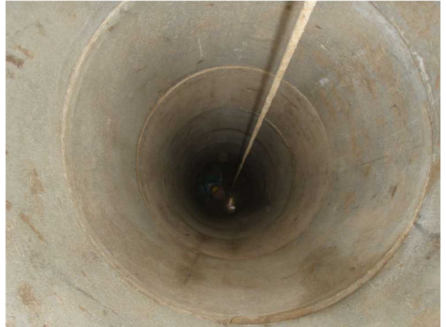
Illustration 5: Patrick est au fond, début de la montée