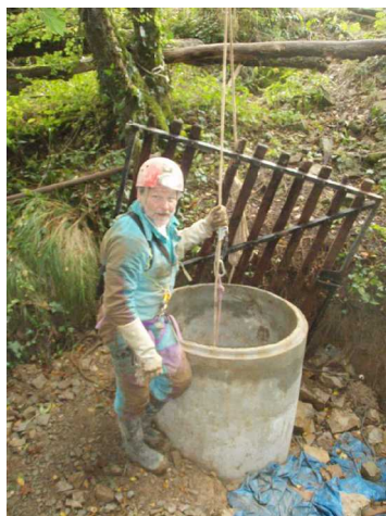
Illustration 6: Sain et sauf