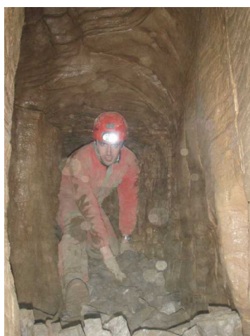
Illustration 9: La gestion des gravats