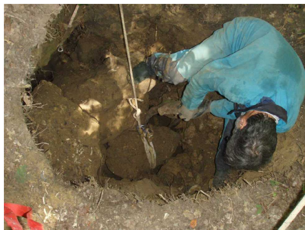
Illustration 3: Un autre bloc

La faim nous arrête vers 13 heures. Je peux faire une photo de la suite, sous l'éboulis. Nous distinguons des éboulis et toute la terre qui est descendue lors de nos travaux. Il y a encore du travail.