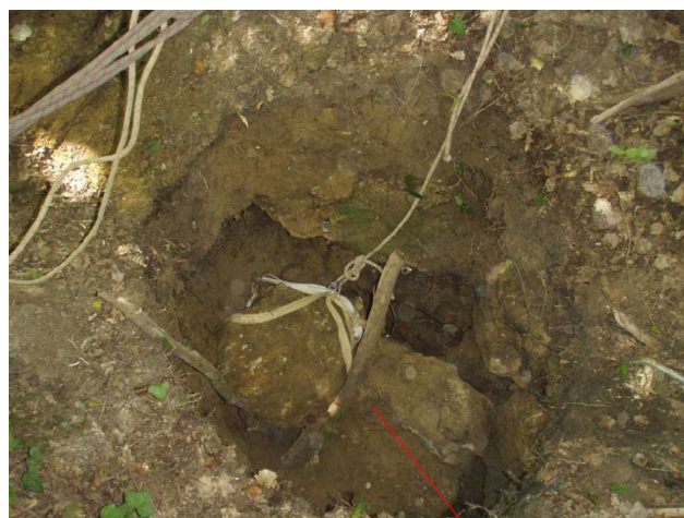
Illustration 2: 1 mètre plus haut, nous plaçons le bloc en relais pour repositionner le tire-fort.