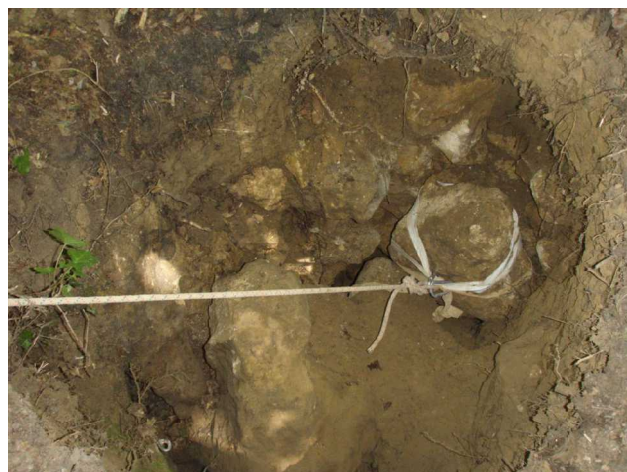
Illustration 1: Le bloc de l'est est sanglé et prêt pour l'extraction.

Michel installe le tire-fort, et l'extraction peut commencer.