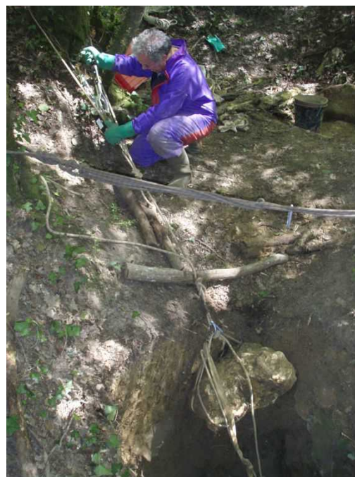
Illustration 5: Michel à la manoeuvre

Projets : Fractionner les 2 gros pavés restants avec la perceuse et les éclateurs.