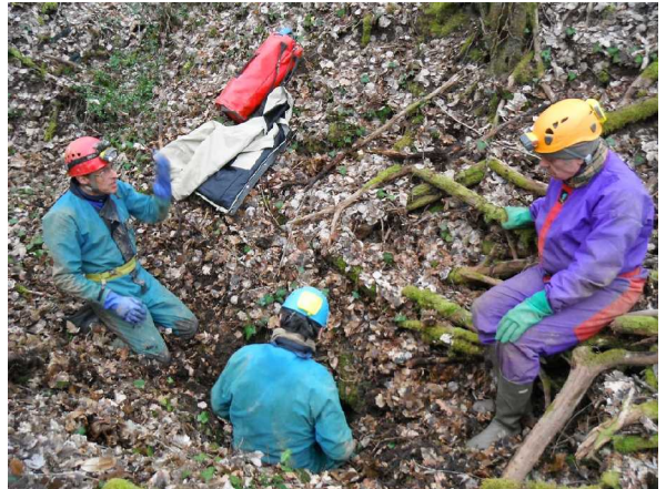
Illustration 3: Christian fait un sondage dans le puits de la nouvelle doline repérée, sous le regard de Michel.

Je pense avoir repéré la doline souffleuse de 2011, mais après avoir visualisé des photos, il s'agit en fait d'une nouvelle doline qui se trouve à 50m au nord de celle de 2011. nous avons donc repéré un nouveau site intéressant.