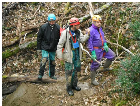
Illustration 1: Discussion au chantier de la doline au boyau.

Nous rencontrons un habitant qui nous donne quelques infos sur la forêt. En particulier, la doline caussenarde est connue sous le nom de « Clotte Redonde » la légende veut que la terre qui a servi à élever la motte féodale a été extraite de cette doline. Le promeneur nous fait partager son soucis concernant la pollution de la doline. Il a lui même enlevé des batteries usagées déposées là.