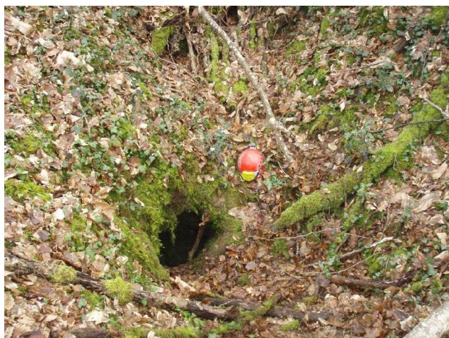
Illustration 6: Benauge Annexe