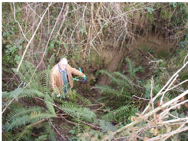
Illustration 3: La doline D-Omet-Mou-X392470

La doline photographiée ci-dessus semble alimenter la source de la Comtesse.