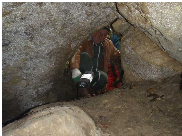
Illustration 7: Dans la grotte de Benauge Amont