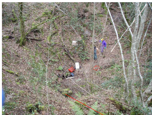
Illustration 5: La doline de la grotte de Bois de Benauge Aval. L'entrée

Cette doline-puits semble déjà repérée en tant que Benauge Annexe. Une échelle est nécessaire pour descendre par une chatière verticale étroite. Jean-Marie a déjà exploré la cavité.