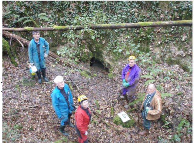
Illustration 8: Benaugue Amont

Nous ne résistons pas à la visite. L'étroiture nous guide vers un petit agrandissement. Tout de suite après, un soupirail donne sur un puits. Je descend en opposition. Mais un ressaut de 2m me fait rebrousser chemin. Il faut une échelle.