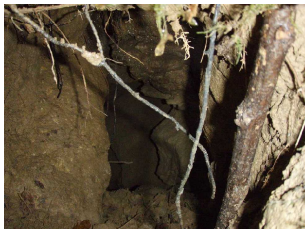
Illustration 4: La vue au delà du petit éboulis de l'effondrement

La doline photographiée ci-dessus semble alimenter la source de la Comtesse.