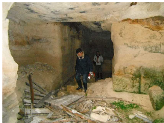
Illustration 1: Une carrière

Maintenant, retour vers les véhicules pour le pique nique.