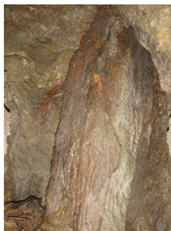
Illustration 3: La coulée de calcite EST