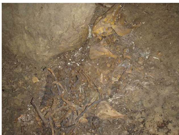
Illustration 4: Un squelette en place dans le boyau EST