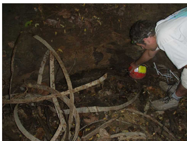
Illustration 5: Le départ côté OUEST

Cette Cahuge a piégé des animaux : chien ?, chevreuil ?... dont on trouve les restes. Nous avons laissé tout en place. Après cette visite surprenante, nous levons le camp des JNS 2011.