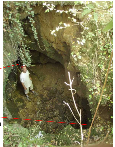
Illustration 1: Mathieu au fond de la Cahuge de la Fricassée

Nous en profiterons pour extraire les ferrailles, verres et plastiques qui pourraient y avoir. Nous ne sortirons pas les ossements, Nous les laisserons en place dans la mesure du possible.