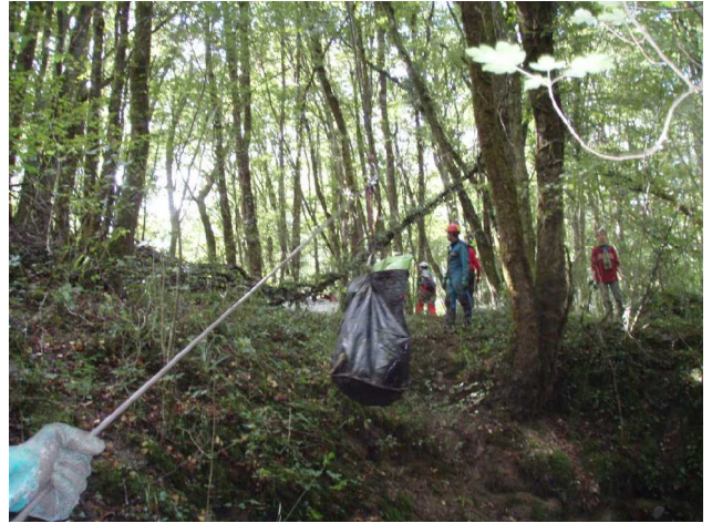
Illustration 5: Les ordures retrouvent la lumière et vont vers le pick-up de Bernard via la tyrolienne