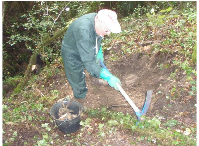
Illustration 8: Claude en action dans la doline