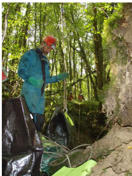
Illustration 2: La tyrolienne

Nous avons installé une tyrolienne pour sortir les sacs de déchets.