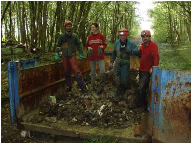
Illustration 9: Le benne en fin de journée.