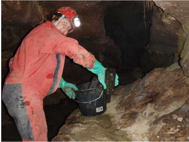
Illustration 4: L'apéro est servi.