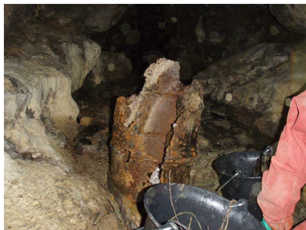
Illustration 1: C'est une oeuvre d'art