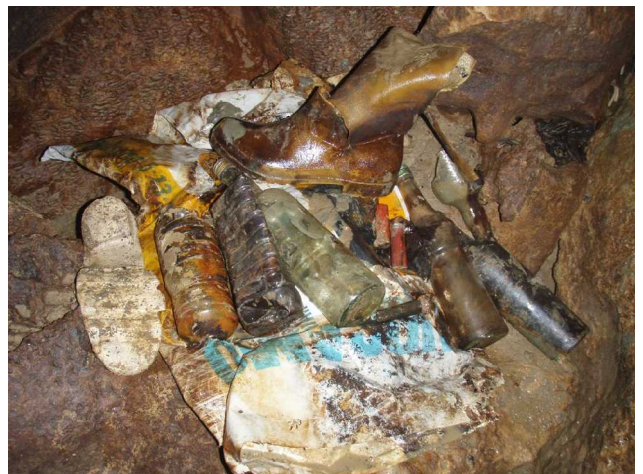
Illustration 7: Mon trousseau de mariage