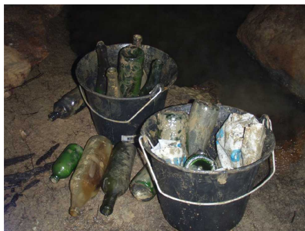
Illustration 3: Détails du contenu des seaux