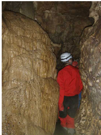
Illustration 6: Concrétions