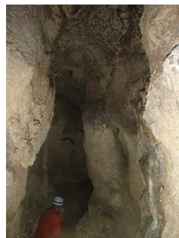
Illustration 13: Cherchez les bêtes

Photos rédaction et mise en page : Gérard