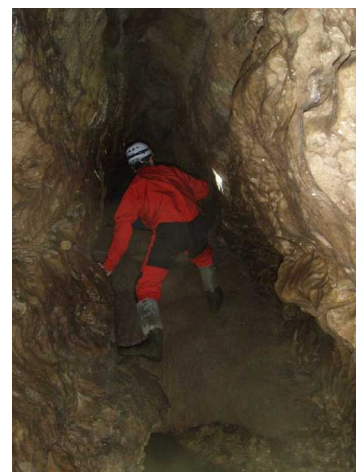
Illustration 4: Progression