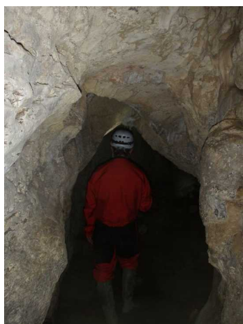
Illustration 5: L'entrée