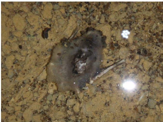
Illustration 9: Cadavre de Chauve souris dans la rivière