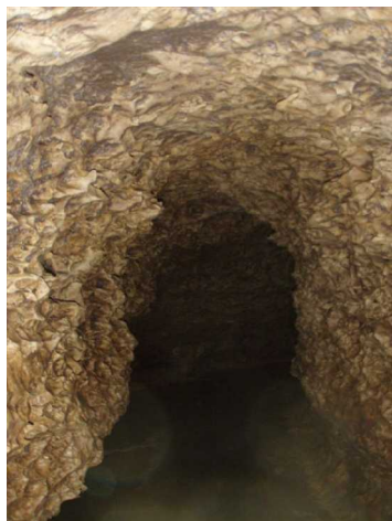
Illustration 7: La galerie