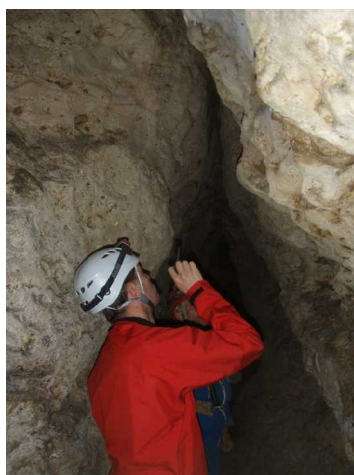
Illustration 3: Recherche