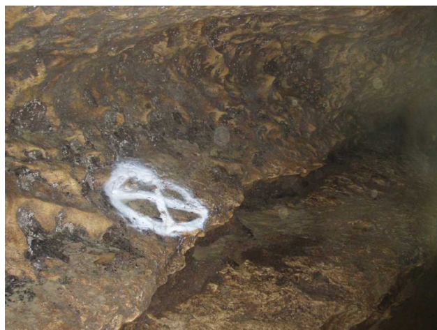
Illustration 10: Ce n'est pas une marque de chauve souris