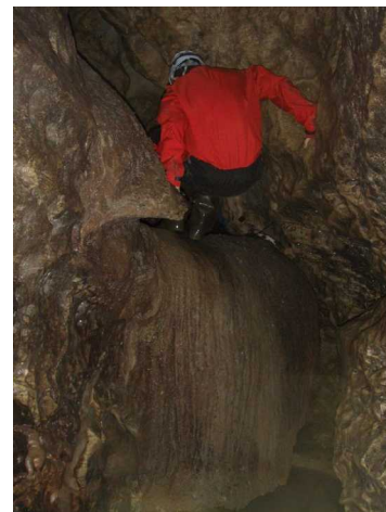
Illustration 8: Escalade