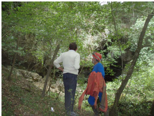
Illustration 2: Etude du site du Trou Noir