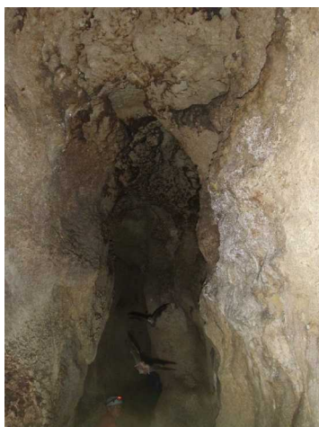
Illustration 11: Chauve souris en vol