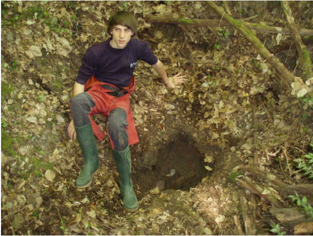
Illustration 2: L'entrée dégagée