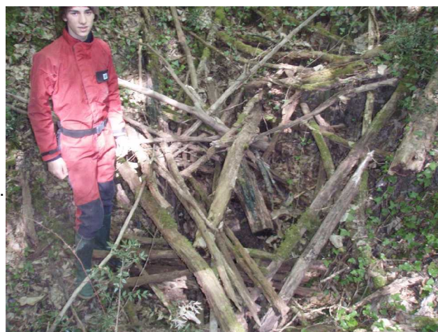
Illustration 1: L'entrée du trou protégée

Nous faisons la topographie du puits et quelques photos.