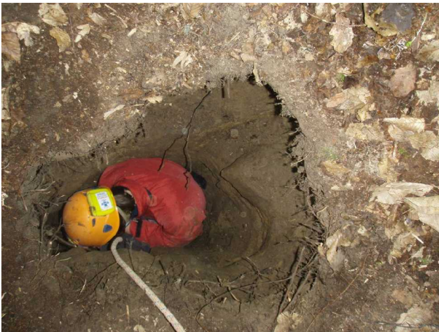
Illustration 4: Titouan dégagé le fond du puits