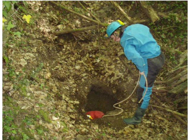
Illustration 3: Les travaux