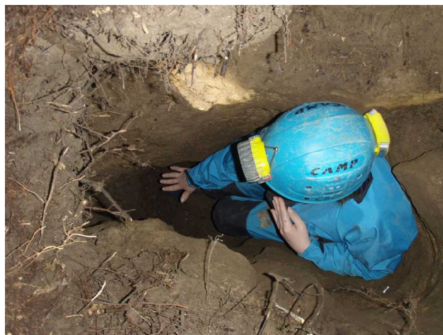
Illustration 6: Une vue du puits. On remarquera son exigüité

Après cette mise en bouche, je décide d'aller voir le Puits de la Souche tout proche pour essayer de passer dans la salle repérée en décembre. Si nous avons le temps, nous en ferons la topographie.