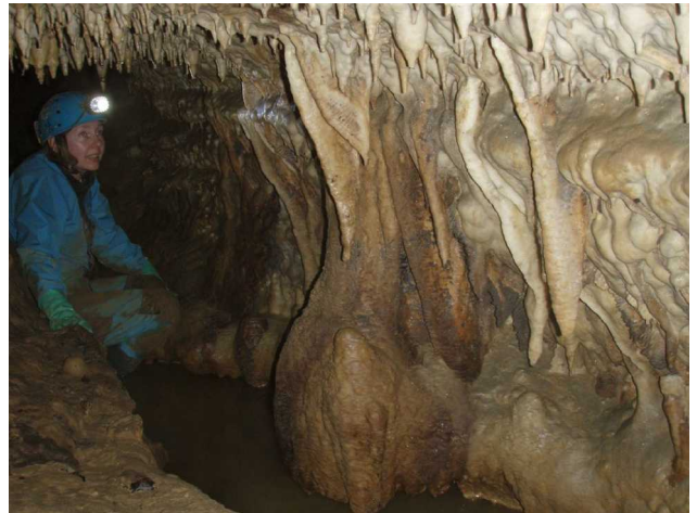
Illustration 12: Quelques concrétions