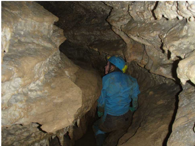
Illustration 11: La galerie en méandre