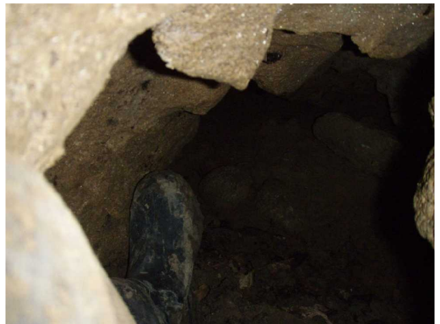
Illustration 5: La suite prise à l'aveuglette avec l'appareil photo en bout de bras.