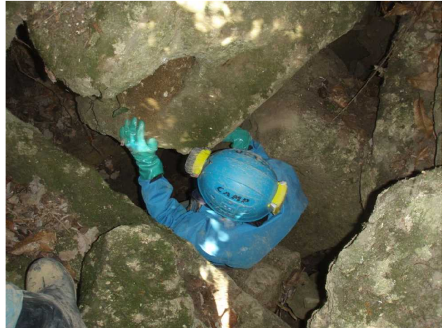
Illustration 10: L'ancienne entrée de la Ségayre

Tranquillement nous émergeons de la grotte à 18h 30 pour un petit goûter de bienvenu au soleil.