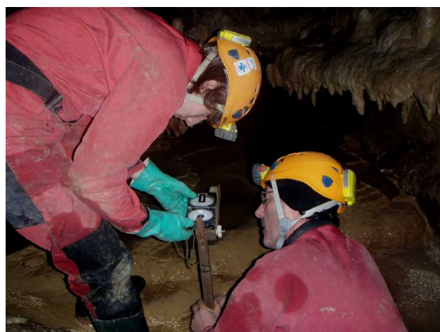
Illustration 5: Lecture de l'azimut sur le trépied de visée