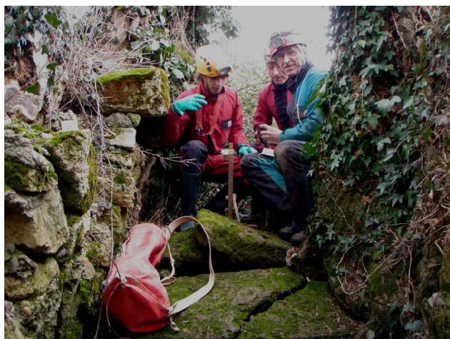
Illustration 3: Le point zéro

Vers 12h30 nous sommes à pied d'oeuvre pour le point topo 00 (Zéro) dans l'aqueduc au pied du petit escalier. A distance égale des bords.