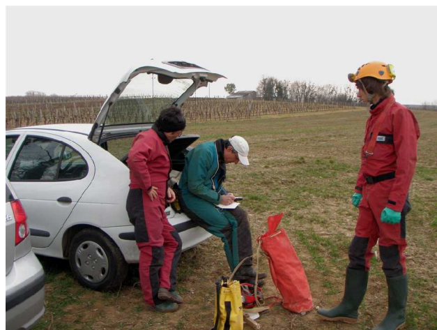
Illustration 2: Les écritures initiales sur le carnet topo