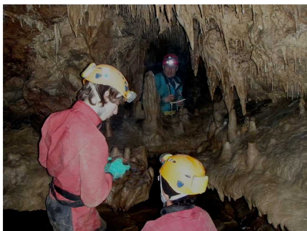
Illustration 6: Ecritures dans un décor de rêve