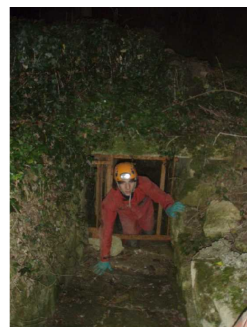
Illustration 7: La sortie de Titou qui clôture la marche.