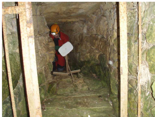
Illustration 4: Marie-Jo à la cible

Les écluses s'ouvriront en arrivant à Bordeaux.