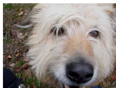
Illustration 12: Le chien du berger des vignes