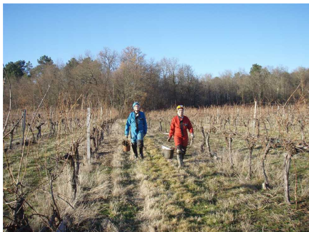
Illustration 10: Fin de la désobstruction, retour vers la Ségayre