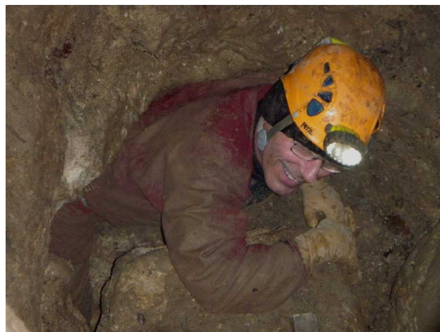
Illustration 6: Le passage vers la première explo.

Par l'étroiture, nous débouchons sur un boyau rocheux et propre, pas trop étroit. 2m plus loin, ce boyau aboutit sur un autre boyau perpendiculaire aux formes plus compliquées et toujours aussi rocheux et agressif pour nos combinaisons. Un petit écoulement d'eau se fait remarquer au sol.