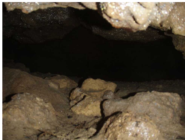
Illustration 9: L'entrée de la salle vers l'amont. La hauteur de l'espace fait 20cm

Après cette petite découverte, nous allons faire une rapide visite à la grotte de la Ségayre par l'ancienne entrée.