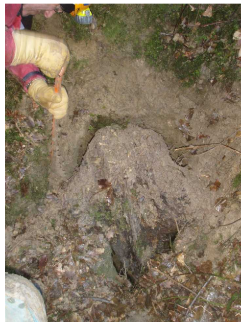
Illustration 5: La souche est dégagée, il ne reste plus qu'à la sortir

Un gros bloc fait de la résistance, mais nous arrivons à le déplacer et il nous laisse un espace entre la paroi. La voie est libre.