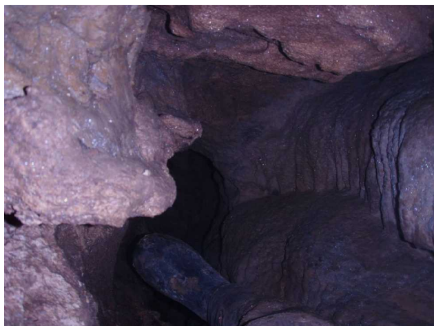
Illustration 8: La suite vers l'aval

Un petit courant d'air parcourt l'ensemble de la cavité. Nous devons être dans les amonts de la Ségayre.