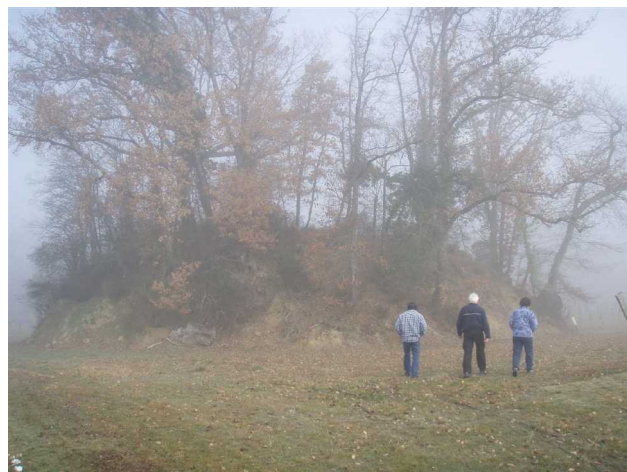
Illustration 1: La motte féodale

Peut être que quelques dolines auront évolué.