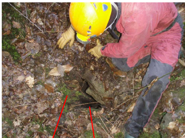
Illustration 4: Entre la souche et la roche la vue sur le puits