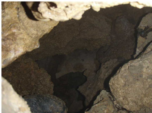
Illustration 7: La suite vue entre les blocs