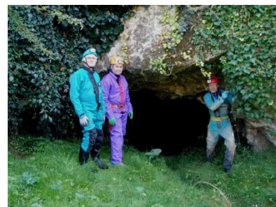
Illustration 1: Le porche de la résurgence