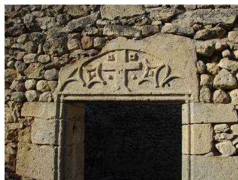
Illustration 11: Symboles