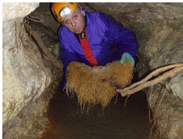
Illustration 10: Les racines ont soif