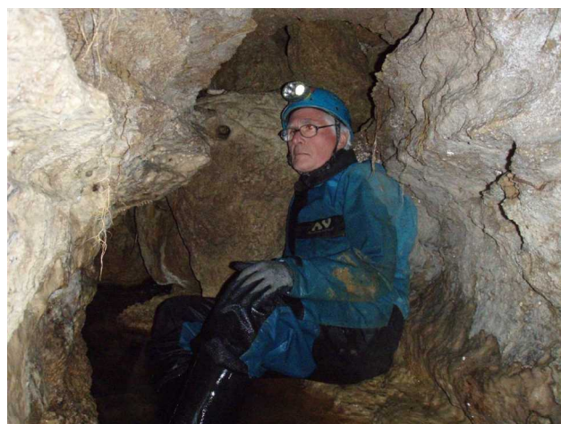
Illustration 4: Guy à l'éboulis terminal

Après les photos nous faisons demi tour vers l'entrée en essayant d'épargner nos genoux.