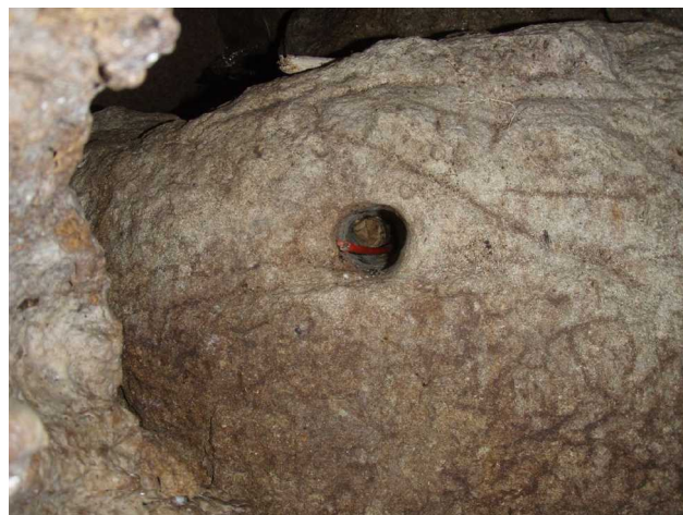
Illustration 3: La mine

Les artificiers amateurs ont laissé tout en plan. Voir l'illustration ci-contre