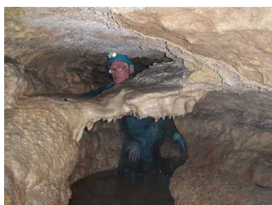
Illustration 5: Le boyau

Les photos de cette page montrent quelques aspects du boyau.