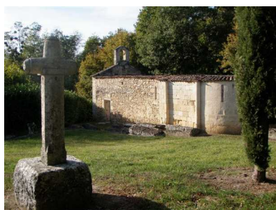
Illustration 12: La chapelle