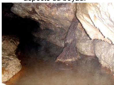
Illustration 7: Les racines