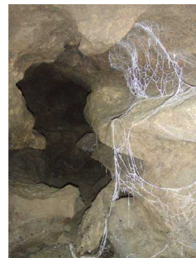
Illustration 16: L'entrée du Labyrinthe