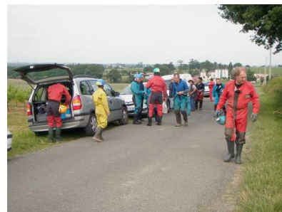
Illustration 1: Encombrements