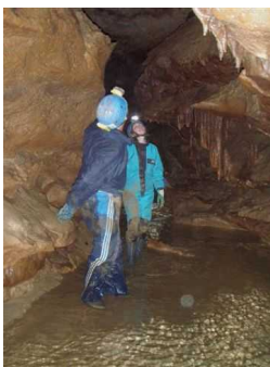
Illustration 8: Galerie