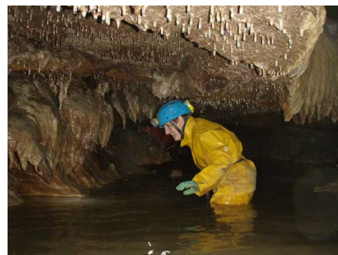
Illustration 10: Attention à l'eau. La coulée de calcite

Les concrétions sont présentes partout, parfois en massifs colorés et imposants.