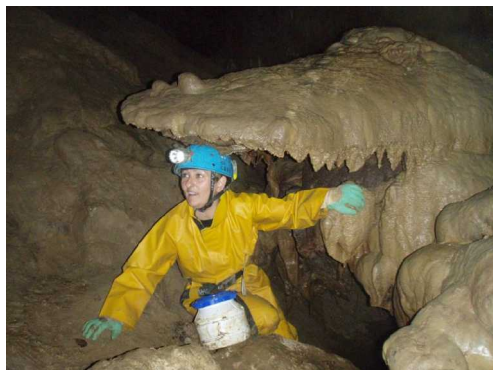
Illustration 9: Attention au crocodile