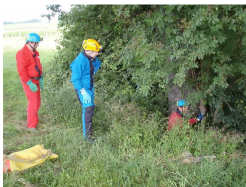
Illustration 3: L'accès à la doline