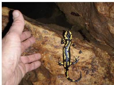
Illustration 14: La gardienne du labyrinthe