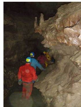
Illustration 6: Galerie