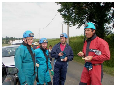
Illustration 2: Une petite faim avant le départ