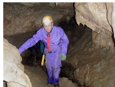
Illustration 5: Progression

Les galeries révèlent leurs variétés, leurs esthétiques, leurs volumes parfois importants.