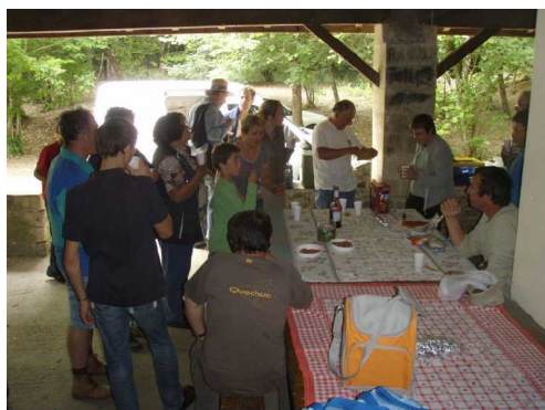
Illustration 12: Le goûter à Frontenac