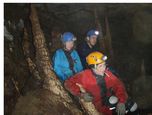
Illustration 11: Terminus, demi tour