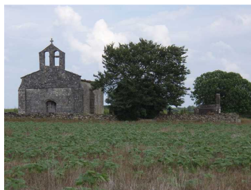
Illustration 13: Ste Presentine

Sur le retour, nous allons faire une visite à une chapelle ruinée ancienne : La chapelle de Ste Presentine.