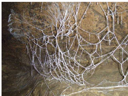
Illustration 15: Les filets de fées