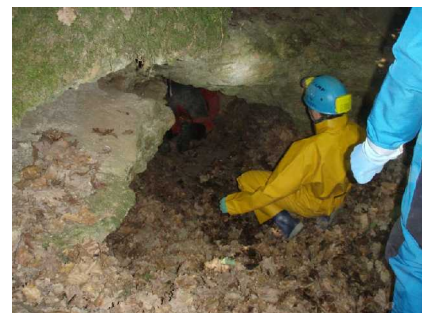
Illustration 4: L'entrée