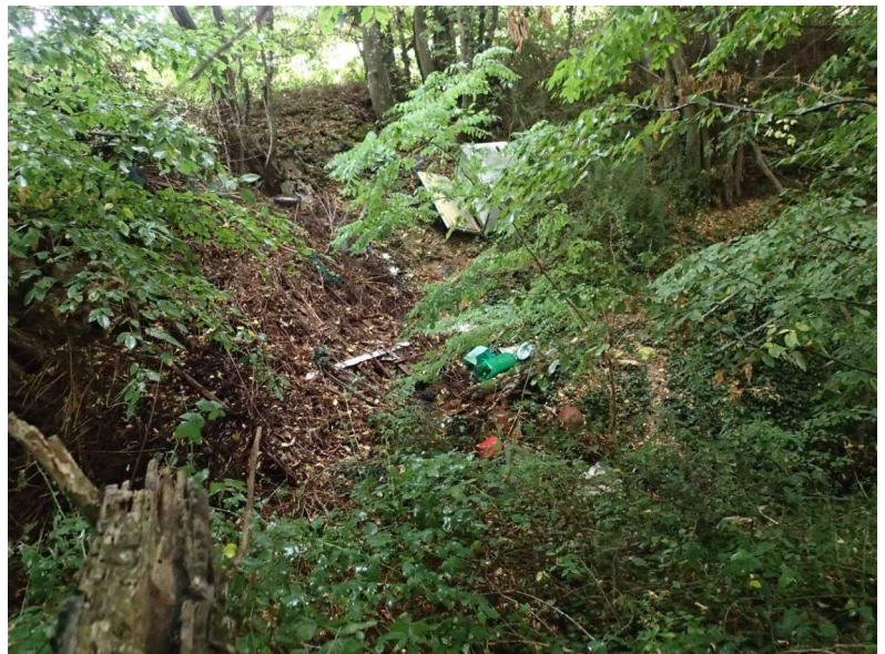
Figure 1: La doline de David et ses encombrants

Et en accord avec ce que nous avons présenté