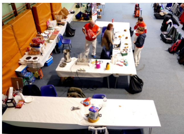
La buvette, avec les gâteaux confectionnés par les volontaires du club