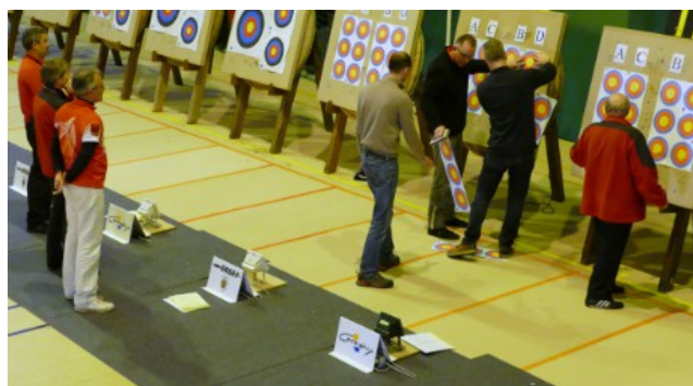
Remplacement des blasons « usés » par des neufs, sous le regard attentif des arbitres.