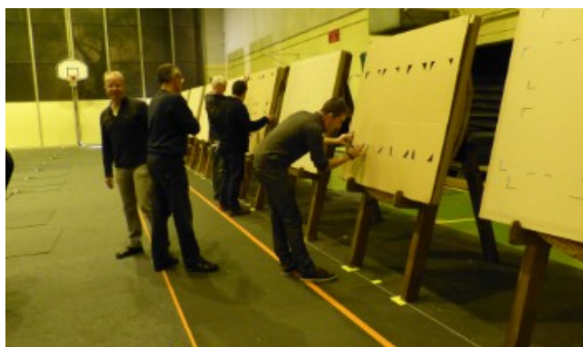
Tracé des emplacement des blasons, agrafage et mise en place des spots.

L'emplacement des blasons est tracé sur les plaques, puis les blasons sont agrafés dessus. Il reste à mettre les éclairages devant chaque cible.