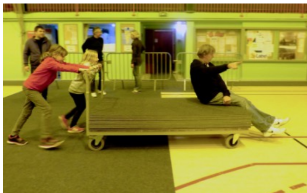
Il faut installer la moquette sur une partie du gymnase pour protéger le sol.